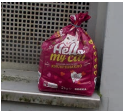
Gesehen in der Vionvillestraße

Ich würde lieber nicht probieren, wär' ich ein Kätzchen in der Stadt. Man sollte nicht so viel riskieren, auch wenn man großen Hunger hat.