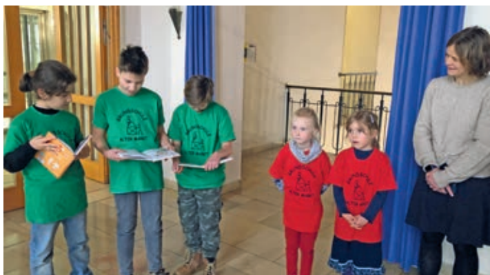
Vierklässler der GS Alter Markt lasen den Erstklässlern die selbst geschriebenen Geschichten vor.

Weitere Informationen über „Das erste Buch“ finden sich unter www.daserste-buch.de .