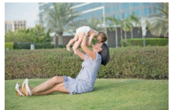
Der Caritas-Kurs für alleinerziehende Frauen soll unter anderem das Selbstwertgefühl der Teilnehmerinnen stärken.