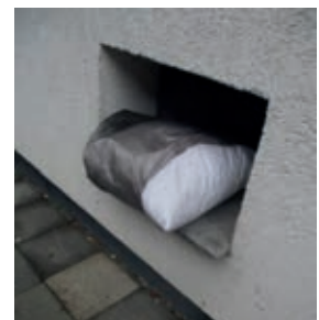
gesehen in der Goschenstraße

Ich nehme das Ruhekissen nicht mit, denn ich habe ja eines zu Haus. D'rum geh' ich zurück mit eiligem Schritt und dann ruhe ich mich darauf aus.