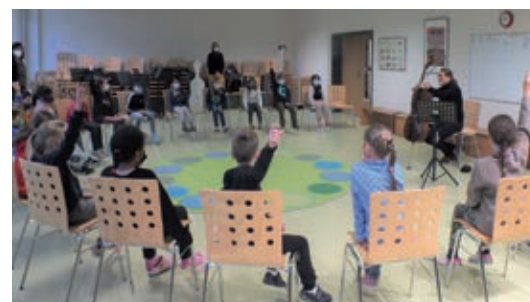
(Text und Fotos: Grit Schubert - GS Alter Markt)

der Grundschule Alter Markt weiter begleiten. Die Kinder freuen sich jetzt schon: Zum Abschluss nach 3 Jahren Üben wird für die 4. Klasse die Möglichkeit bestehen, dass sie den Arbeitsplatz von ihrer Schirmherrin, und zwar die Elbphilharmonie, kennenlernen dürfen.