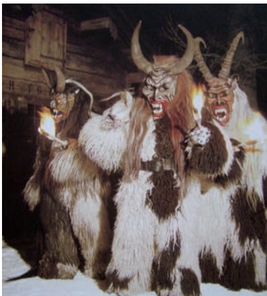
(Foto: Schauteufel von Paul Werner, München, Kulturgeschichte des Brauchtums vom Advent bis Dreikönig)

Der Schaduwel und das Schauteuffelskreuz im alten Hildesheim von Wilhelm Hartmann. Eine historisch-volkskundliche Studie Alt Hildesheim 12/1963.