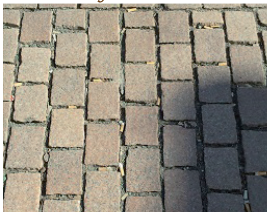
Fugenfüllung mit Kippen - Ampelbereich Michaelisstraße/Kardinal-Bertram-Str. - Foto: Peter Spilker

Jeder Filter enthält etwa 2-6 mg Nikotin, ein Nervengift, Schwermetalle wie Arsen, Blei, Kadmium, Ammoniak. Eine einzelne Kippe in der Hand eines Kleinkinds oder in einem 200-Liter-Aquarium hat