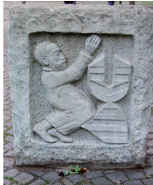
(Text und Foto vom Gedenkstein: Karl Scheide)