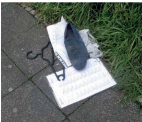
Dieses „Kunstwerk“ fand ich an der Goslarschen Straße

Das Stilleben ist sehr interessant. Der Künstler wird hier leider nicht genannt. Vielleicht will er im Verborgenen bleiben? Bescheidenheit kann man auch übertreiben.