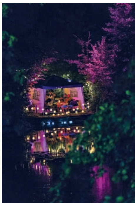
Gastgeber*innen gesucht! Bei den Hildesheimer Wallungen können sich auch Gruppen und Institutionen bewerben, die einen Spielort auf dem Festival gestalten wollen.