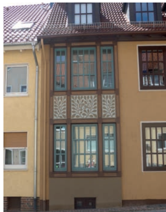
Diese Fassade kann im Michaeliquartier gefunden werden - Aber wo? Raten Sie mit!

Donnerstag, 7. Dezember, 18 Uhr: samo.fa 2017 „Rückblick - Einblick - Ausblick“ von samo.fa (Riedelsaal, VHS Hildesheim) |