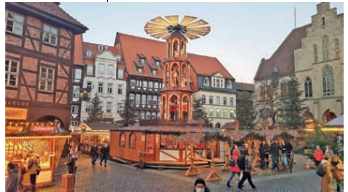
Weihnachtsmarkt 2021 in Hildesheim

Im Supermarkt, auf der Straße, im Büro und sogar aus dem eigenen Spiegel. Wenn überall schlecht gelaunte maskierte Gesichter entgegen blicken, wird es Zeit, mal etwas dagegen zu tun. Mit Eintrag der vollständigen Corona-Impfung, kommen alte Möglichkeiten zurück. Doch die gleich maximal auszureizen, liegt auch vielen doppelt Geimpften fern. Nur weil man darf, muss man nicht. Trotzdem haben wir es nach langer Pause endlich wieder gewagt: Unser erster „After-Corona-Stammtisch“ mit Gleichgesinnten. Geplant vorerst nur als Test einer neuen Location in kleiner Runde gab es trotzdem jede Menge zu berechnen. Das Wetter zum Beispiel, dieser ziemlich missglückte Sommer, der so schnell wieder vorbei war, dass man erst allmählich realisierte, dass Herbst, Winter und möglicherweise die nächste Welle schon wieder vor der Tür stehen.