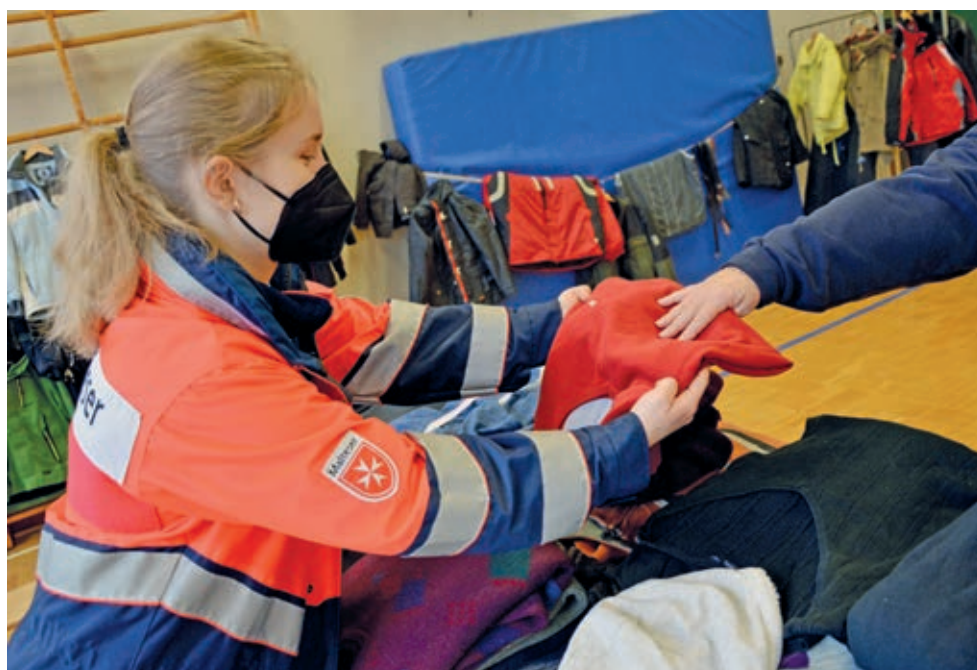
Reiche Kleiderauswahl für die Besucher des Wohlfühlmorgens; Bildquelle: Lukas/Malteser

Herausgeber: Axel Fuchs Redaktions- und Anzeigen-Anschrift: Ostertor 7, 31134 Hildesheim, Tel. (0 51 21) 23947 Redaktionsschluss der nächsten Ausgabe: Freitag, 23. Dezember 2021 E-Mail: oststaedter@t-online.de Internet: www.hildesheimer-stadteilzeitungen.de