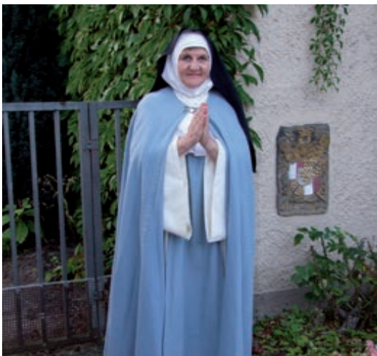
Kostümführerin vor Gedenktafel

Am Freitag, dem 03. September 2021, fand im Michaelisviertel eine neue Kostümführung unter dem Motto „Dem Himmel so nah – St. Magdalenen“ statt. Veranstalter waren die Hildesheimer Kostümführer. In mehreren Gruppen wurde den Teilnehmerinnen und Teilnehmern der Führung Einblicke in das Leben und Wirken besonderer Persönlichkeiten des Viertels eindrucksvoll vermittelt.