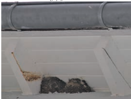
Junge Mauersegler - Alter Markt