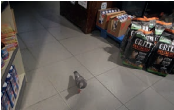
Diese Taube entdeckte ich in einem Supermarkt in der Innenstadt.

Kleine Taube, also ehrlich. Du lebst hier viel zu gefährlich. Alles steht hier bereit für den Grill. D'rum versteck' dich lieber und bleib' still. Sonst landest du am Ende noch auf einem Grill, wär' traurig doch.