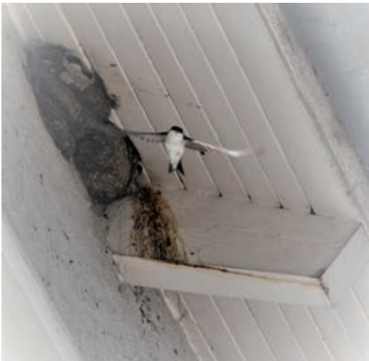
Mehlschwalben-Nest Alter Markt

Mauersegler und Mehlschwalben mit ihren Nestern im MichaelisQuartier - Nisthilfen Teil 3 Vielleicht haben Sie es gemerkt: Die Mauersegler, die gerade noch mit ihrem Nachwuchs und kräftigen Sreeiiih-Rufen im Quartier um die Häuser zogen, sind schon weg! Sie kommen als letzte Anfang April und gehen als erste Ende Juli! Sie sind nur kurz bei uns, um zwei Junge groß zu ziehen und verbringen die meiste Zeit des Jahres im südlichen Afrika.