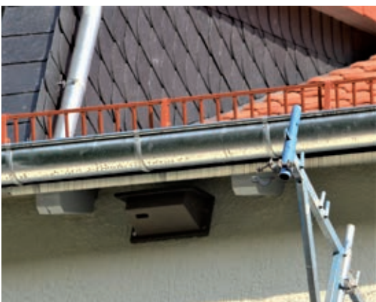
Mauerseglerkasten an der VHS

Leider werden sie bei uns immer weniger! Mangelnde Brutplätze durch Sanierungen und zunehmend Insektenknappheit sorgen dafür! Im MQ wurden deshalb Nisthilfen an der VHS und am Alten Markt angebracht und mehrfach gern angenommen. Anders unsere Quartiers-Mehlschwalben: Sie kommen bereits im März und bleiben bis September oder Oktober, wenn sie eine zweite Brut großziehen können. Bis zu sechs Küken sind normalerweise in einer Nestschale, ganz oben möglichst in Eigenbau unter der Traufe „angeklebt“. Das etwas brüchige Material stammt zum großen Teil aus den Dachrinnen, wo gibt es noch Lehmputzen?