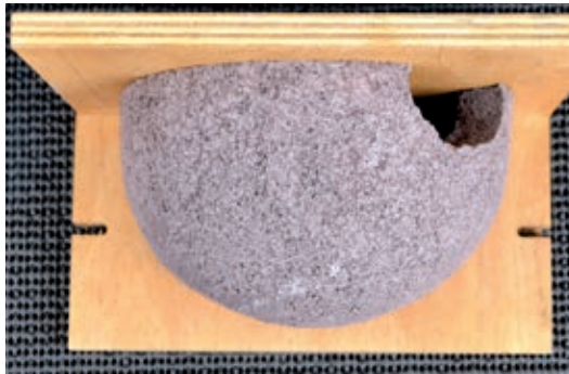
Nisthilfe für Mehlschwalben - NABU

Da sollten Nisthilfen-Angebote doch eigentlich überannt werden. Die Erfahrung am Alten Markt stützt das noch nicht, die elf Nester an den Nachbarhäusern in Eigenbau und ständiger Reparatur werden eindeutig bevorzugt! Geduld ist angesagt, eine Veränderung bei der Anbringung ist mit einer bereits beauftragten Fassaden-Neugestaltung verbunden.