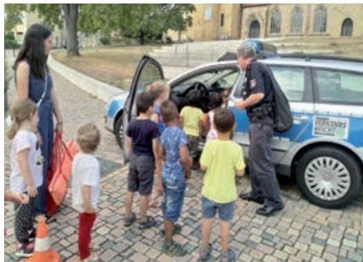
Aktion September 2019