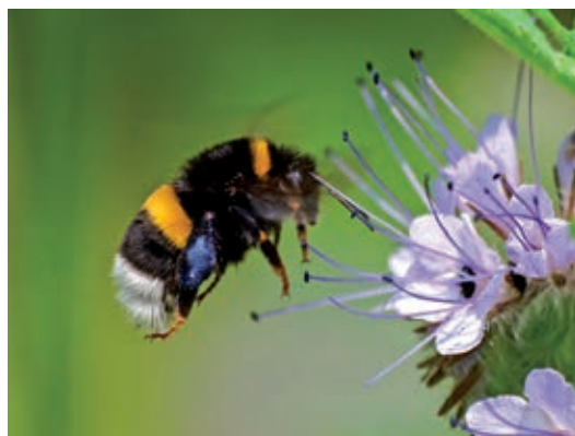
Text: Dieter Goy - Foto: Erdhummel - Copyright NABU

Mir sieht das alles eher etwas behäbig aus, tiefer Summton, langsam unterwegs, ruhige Flugbahnen. Unruhig sind da eher die Wespen! Wenn Sie das selbst mal beobachten wollen: eine gute Gelegenheit bietet sich vom 5. bis zum 13. August an. Da ruft der NABU zum 2. Teil des Insekten Sommers auf, Insekten zu zählen. Und das ist in diesem Jahr