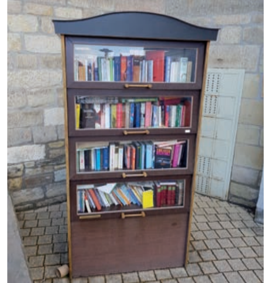
Bücherschrank am ehem. Michaelisheim - Foto: Archiv