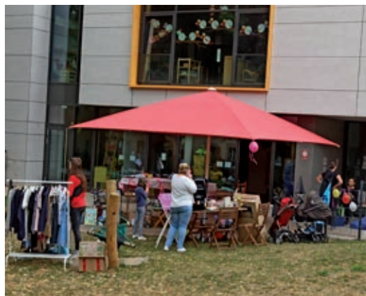
Text und Foto: Kristina Markwort

Mit einer Tasse Kaffee und einem netten Gespräch untereinander, verging die Zeit wie im Flug. Wir freuen uns schon auf das nächste Jahr.