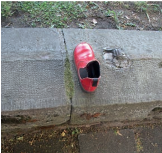
Gesehen am Theater

Oh, ich denke mir, Nanu? Was macht hier ein Kinderschuh? Vor dem Theater auf der Mauer liegt er nun wartend auf der Lauer. Kommt wohl der zweite Schuh zurück? Ich wünsch' auf jeden Fall viel Glück.