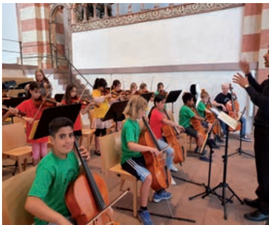
Text und Foto: Grit Schubert

Mit einem Auftritt in der Michaeliskirche beendete die Klasse 4a der GS Alter Markt am 2. Juli ihre Streicherklassenzeit. Seit der zweiten Klasse spielte jedes Kind in der Klasse ein Streichinstrument - Geige oder Cello.