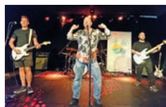
Stonevision fegen das Publikum an die gegenüberliegende Wand.