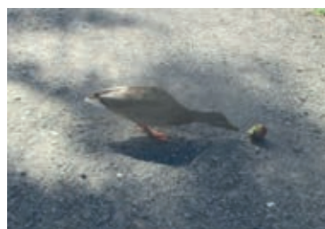
Die Ente mit Apfel beobachtete ich am Hohnsen

Obst ist gesund, denk' ich mir hier. Nicht nur für Menschen, auch für's Tier. Es scheint zu schmecken jedenfalls. Man sieht es an dem langen Hals.