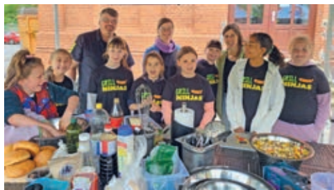
Daumen hoch für leckere und nachhaltige Ernährung auch in der Elisabethschule in der Neustadt.

Die Sparkasse Hildesheim Goslar Peine stellt Mittel aus dem Reinertrag der Lotterie Sparen und Gewinnen zur Verfügung, damit Grundschulen an der Aktion „GRILLNINJAS“ teilnehmen können. Im letzten Jahr waren das rund 75 Grundschulen. Seit Jahresbeginn 2024 haben weitere rund 40 Besuche stattgefunden. Jetzt nach dem Ende der Ferien starten die ersten Besuche. Ziel der Aktion ist es, Kindern und Jugendlichen zu zeigen, was es heißt, frisch und nachhaltig zu kochen. Mittlerweile sind die GRILLNINJAS ein Team aus über 30 Leuten, das sich auf die Fahne geschrieben hat, Umweltschutz und einen gesunden Lebensstil inhaltlich fundiert und mit Freude an der Sache zu vermitteln. Es geht darum, den kommenden Generationen einen intakten, lebenswerten Planeten zu hinterlassen. Um nicht weniger. So wie wir heute handeln, werden die Generationen morgen leben.