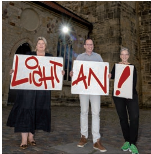
Text und Foto: Angelika Rau-Culo

Der Michaelistag liegt in diesem Jahr 1.000 und zwei Jahre nach der Weihe unserer Kirche wieder einmal auf einem Sonntag. Aus diesem Anlass feiern wir einen festlichen Kantatengottesdienst als alm-Regionalgottesdienst (St. Andreas, St. Lamberti und St. Michaelis).