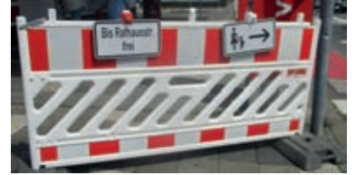
Entdeckt an der Baustelle am Zingel

Was ist mit all den Ander'n dann? Sie dürfen weiter g'radeaus? Diverse, Frauen oder Mann? Wer kennt im Schilderwald sich aus!