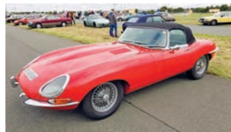
Traumauto der 60er Jahre - Jaguar-E

Das Treffen bot nicht nur die Möglichkeit, das Kulturgut Oldtimer aus nächster Nähe zu bewundern, sondern auch, sich mit Gleichgesinnten auszutauschen und die gemeinsame Leidenschaft für klassische Fahrzeuge zu zelebrieren.