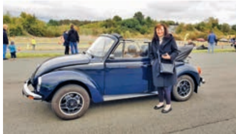
Weißt Du noch? So einen hatte ich auch mal

Die liebevoll gepflegten Fahrzeuge, die auf dem weitläufigen Gelände ausgestellt waren, reichten von eleganten Klassikern der 20er Jahre bis hin zu kultigen Modellen der 80er Jahre. Jeder Oldtimer erzählte seine eigene Geschichte, während die technischen Meisterwerke und das zeitlose Design die Herzen der Autofans höher schlagen ließen. Von glänzenden Cadillac-Limousinen über sportliche Porsche-Modelle, charmante VW Käfer bis hin zu nostalgischen Uralt-Vehikeln und Nutzfahrzeugen – die Vielfalt war beeindruckend.