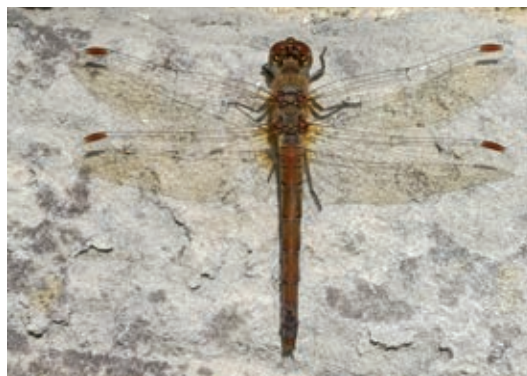
Libelle im Magdalengarten