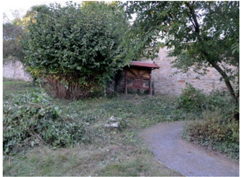
Der Bereich für die Wildbienen ist wieder frei

Kulturlandschaften benötigen Pflege, wenn sie erhalten bleiben sollen. Das erledigen am besten Tiere, z.B. Schafe, oder ein Mensch mit Maschinen-Einsatz. Das gilt auch für die Naturflächen im Magdalenengarten, sonst droht Überwucherung und Verbuschung der Blühwiese auf der Streuobstwiese, der Totholzhecke und sogar den Nisthilfen der Wildbienen.