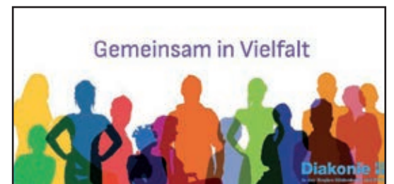
Text und Fotos: Mandy Steinberg

atives Bastelangebot bietet Gelegenheit, dass auch die Kinder auf ihre Kosten kommen und ihre eigenen Weihnachtsüberraschungen gestalten können. Alle Gäste sind im Michaelis Weltcafé herzlich willkommen, eine Anmeldung ist nicht erforderlich. Gehen Sie vorbei und feiern eine besinnliche Zeit des Advents!