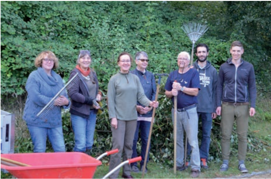
Das NABU-Team beim Pflegeschnitt