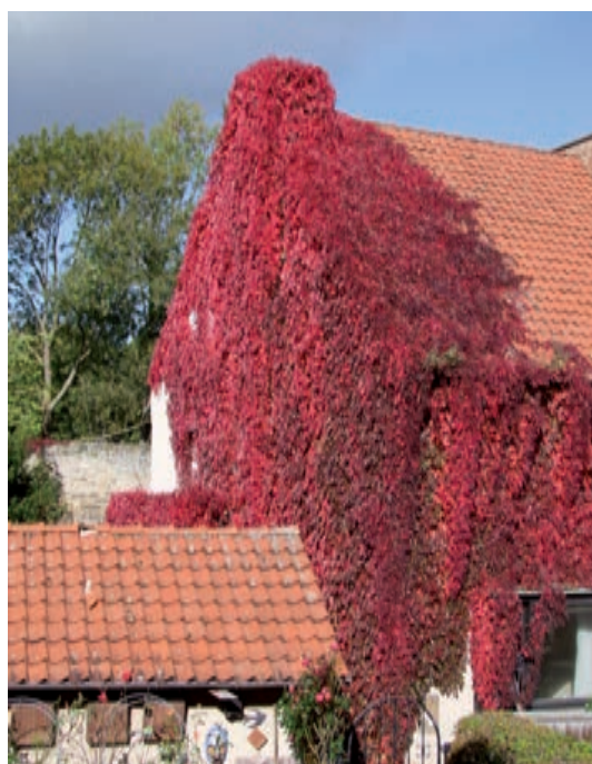
Weinlaub im Wohl