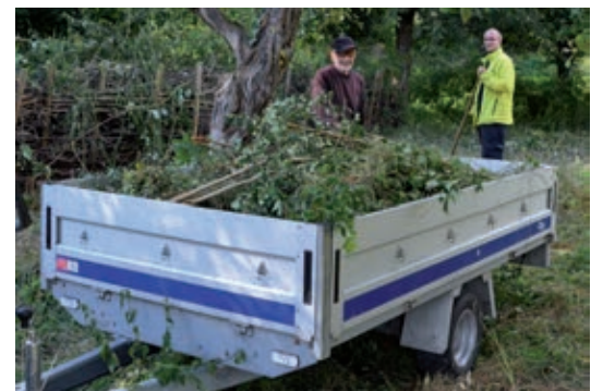
Die Abfuhr zum Kompostwerk

Sogar eine Brezelpause mit Getränken war „eingebaut“, sodass der Spaßfaktor nicht zu kurz kam. Ein Blick in die Zukunft: Bei Bedarf würden alle gern wieder antreten!