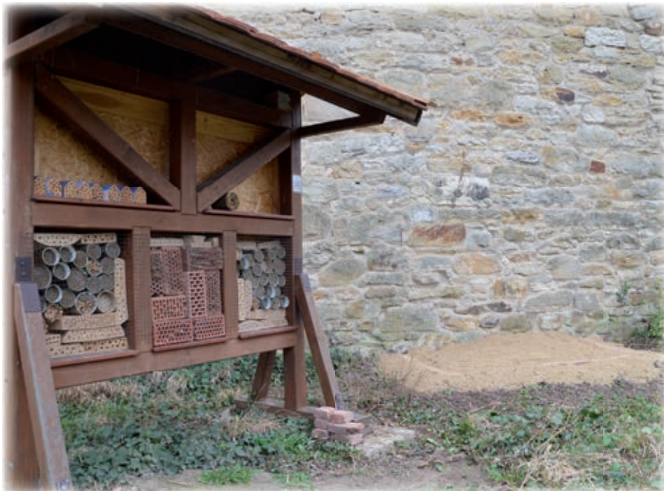
Wildbienenhaus mit Sandhügel - Fotos und Text: Dieter Goy