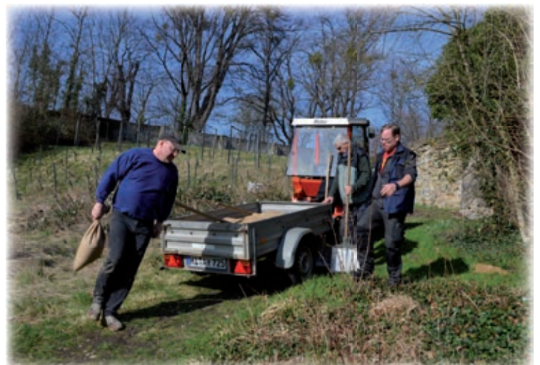
Abladen am Wildbienenhaus im Magdalenengarten

Diese Sponsoren sind bei der Finanzierung der Doppelseite über da