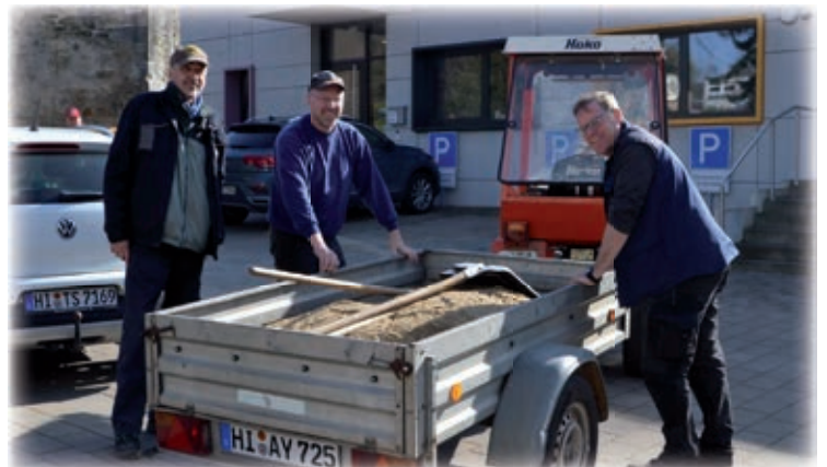
Neue Zugmaschine für den Transport zum Wildbienenhaus