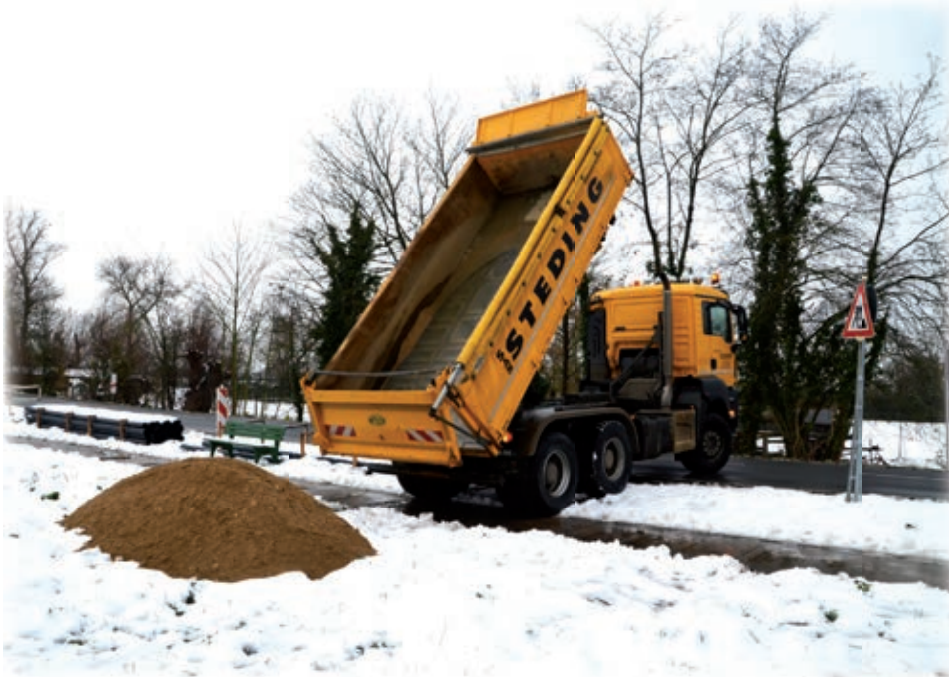
Firma Steding liefert den Sand in Sarstedt an