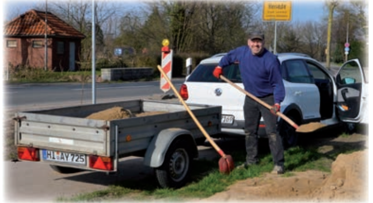
Umladen für den Transport zum Magdalenengarten