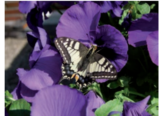
Text und Foto: Karl Scheide

Der Schwabenschwanz (Papilio machaon) ist ein Schmetterling aus der Familie der Ritterfalter. Er verdankt seinen Namen der Form der Flügel.