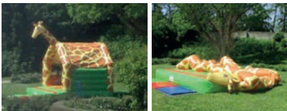
Gesehen im Magdalengarten

Gibt's in der Stadt jetzt einen Zoo? Warum las ich das nirgendwo? Eine Giraffe ist zu seh'n. Die sah ich früher nie dort steh'n. Doch ist das Tier ganz schnell verpufft. Denn es enthielt nur heiße Luft.