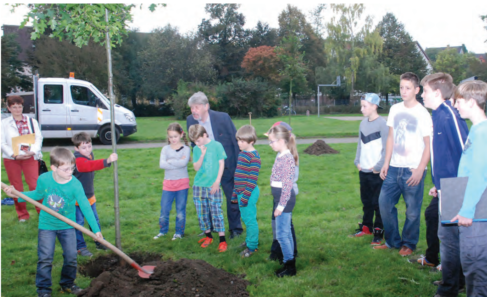
Kinder des Hortes Elisabethschule pflanzen mit Bürgermeister Ekkehard Palandt drei Bäume zur Deutschen Einheit.