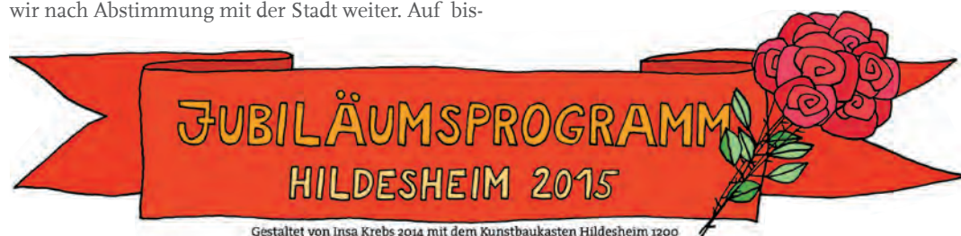
Gestaltet von Insa Krebs 2014 mit dem Kunstbaukasten Hildesheim 1200

einen guten Weg gebracht! Das nächste Treffen ist am 21. November 2014 im Rosenmuseum (17 Uhr). Eine Beteiligung ist noch immer möglich! Kontakt: http://michaelisquartier-hildesheim.de/index.php/kontakt