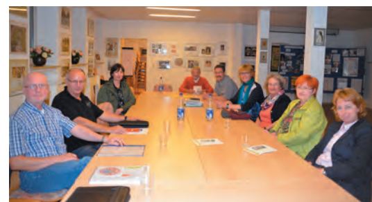
Treffen der Planungsgruppe