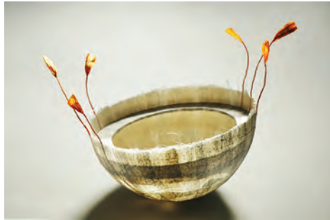
Marlis Maehrle Schalenobjekt aus Papier