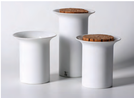
Heike und Ulrich Raupach Gewürzdosen aus Porzellan