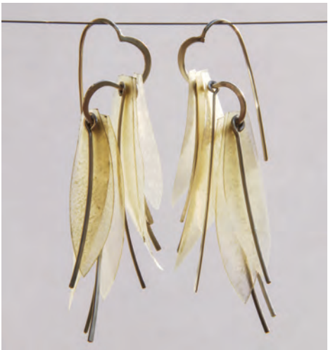
Merle Küsster Ohrschmuck aus Silber und Pergament

Eintritt frei: zur Ausstellung „Kunst – Handwerk – Design zum Fest“ über drei Etagen des RPM