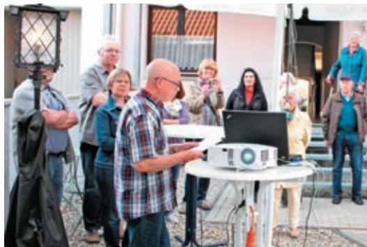
Langer Hagen 31