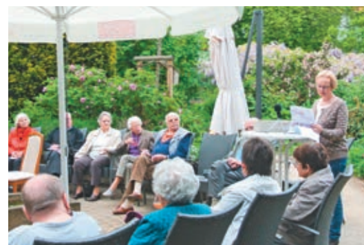
Langer Hagen 39, Michaelisheim

An elf Abenden im Mai waren ganz unterschiedliche Häuser im Michaelisquartier Treffpunkt für Anwohner/innen und alle anderen, die mehr erfahren wollten über die Geschichte(n) der Menschen, die hier wohnten oder wohnen. Mit viel Liebe zum Detail hatten Männer und Frauen aus dem Quartier die Reihe „Häuser erzählen“ vorbereitet. Interessiert und zum Teil mit weiterführenden Geschichten zu den