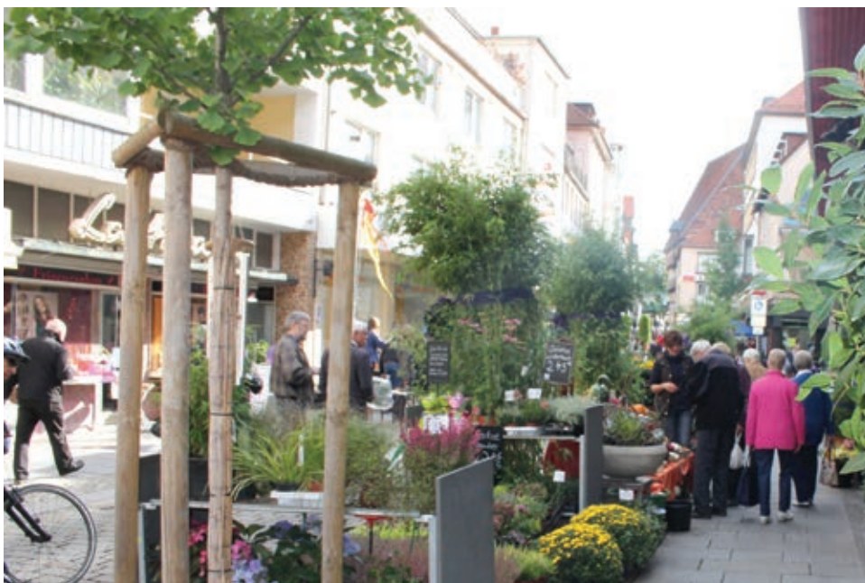
Das Straßenfest lockt jedes Jahr hunderte Besucher auf den Hofweg an den Kurzen Hagen.

Weitere Informationen im Internet unter www.facebook.com/KurzerHagen .