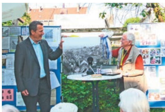
Alter Markt 64