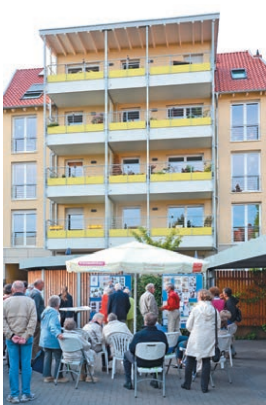
Alter Markt 22