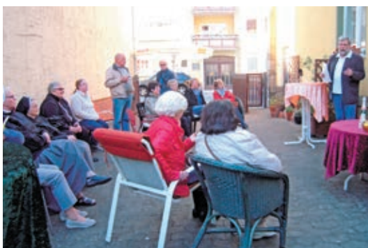
Langer Hagen 25