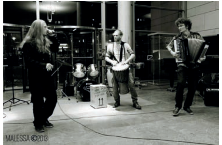
Makatumbe vereint spontane Obertongesänge und human-beatboxing.