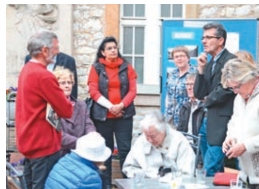
Mühlenstraße 24, Magdalenenhof