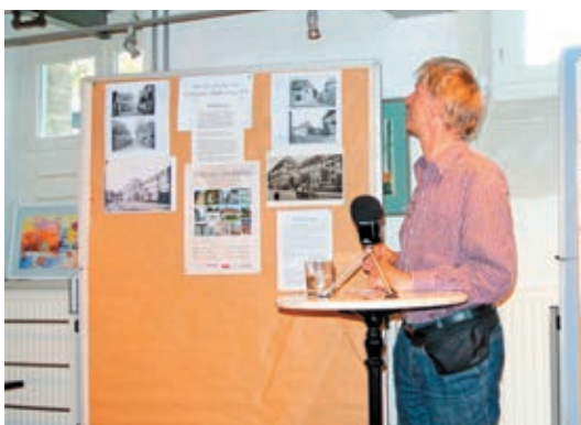
Pfaffenstieg 4-5, Volkshochschule