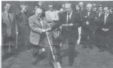
Spatenstich zur Regenwasseranlage im Jahr 2000

Aufgrund ihrer zahlreichen Aktivitäten im Bereich der Ökologie wurde die RBG 1997 als Umweltschule Europas ausgezeichnet. Neben einem eigenen Blockheizkraftwerk und einer Photovoltaikanlage wurde eine Regenwassernutzungs- und Versickerungsanlage gebaut, durch die die Schult Toiletten komplett mit Regenwasser versorgt werden können. Auf diese Weise wird kostbares Trinkwasser eingespart. Höhepunkt ihres Engagements für die Umwelt war die Teilnahme der Robert-Bosch-Gesamtschule an der Weltausstellung EXPO