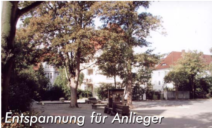
Entspannung für Anlieger