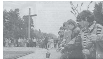
850 Schüler und Lehrer gedachten mit einer Menschenkette auf dem Nordfriedhof des Kriegsendes vor 50 Jahren.

In einer Projektwoche im Herbst 1993 thematisierte die gymnasiale Oberstufe die Nordstadt. Im Hintergrund stand das Anliegen, als größte Bildungseinrichtung im Stadtteil hinter der Bahn das dortige Leben stärker als bisher in den Unterricht einzubeziehen und diesen dadurch realitätsnäher zu gestalten. U. a. beschäftigten sich die Deutschkurse mit Erzählungen und Gedichten über die Nordstadt, im Fach Kunst wurde ein Fotoprojekt „Bahnhofsleben“ erarbeitet. Es ist ein Charakteristikum der RGB, dass Schülerinnen und Schüler ihre Schule selbst renovieren. Dies geschah z.B. im Rahmen einer Projekt-