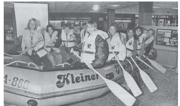
Der „Kleine Tümmler“, benannt nach dem Schweinswal, dient für Erkundungen vor der dänischen Insel Aarö.

woche des 11. Jahrgangs mit dem Thema: „Lebensraum Schule“ (Juni 1994). Unterstützt von ihren Lehrern wurden die Flure des Oberstufengebäudes neu gestrichen, sämtliche Toiletten von Grund auf saniert und Klassenräume mit großen Wandbildern verschönert. Am 8. Mai 1995 gedachten 850 Schüler und Lehrer mit einer Menschenkette auf dem Nordfriedhof des Kriegsendes vor 50 Jahren. Sie nahmen sich bei den Händen und schlugen auf diese Weise eine Brücke von den Gräbern der deut-