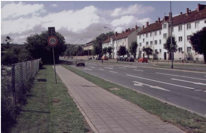
Ab hier dürfen die Fahrradfahrer nicht mehr weiterfahren, die Einfahrt zur Kleingartenanlage ist nur ca. 50 Meter weiter.

Ein echter Schildbürgerstreich der Stadtverwaltung. Vielleicht