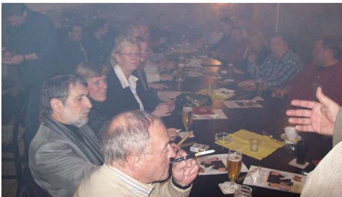
Der historische Gewölbekeller, nun Raucherraum, im Bistro Torhaus

Ich hoffe, das war nicht das einzige Mal, so Pascale Merges. Nach dem Sommer, vielleicht im September oder Oktober, wenn es wieder nieselig wird und die Biergarten-Saison zu Ende geht, wird er sicherlich wiederholt. Vielleicht haben wir bis dahin eine kleine Lockerung des Rauchergesetzes, hofft Pascale Merges. Die dritte Station des Abends war die Cocktail-Bar „Potters“