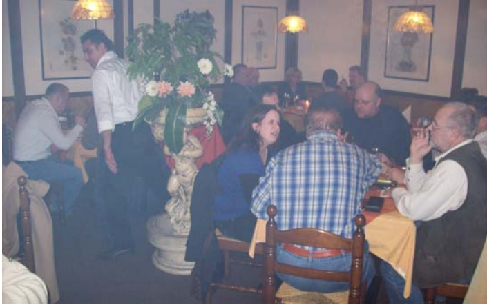
Der Abend startete in dem gemütlichen Raucherraum des Ristorante Capri