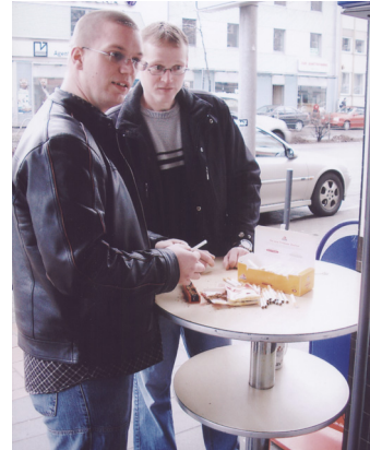
Die zwei haben bereits eine preiswerte Alternative gefunden.

Demnächst werden die bisher so günstigen Single Packs wie West, Marlboro usw. vom Markt genommen, da sie laut neuer EU-Verordnung genauso hoch besteuert werden sollen wie herkömmliche Zigaretten. Damit sind sie natürlich uninteressant für den Käufer. Somit wird den Leuten wieder ein bißchen mehr Freiheit genommen. Sie sollen in Zukunft die teuren Zigaretten kaufen, damit der Staat ordentlich verdient. Aber es gibt auch Alternativen. Erkundigen Sie sich bei Ihrem Tabakfachhändler, von denen es in Hildesheim zum Glück noch einige gibt, trotz aller Erschwernisse durch die Bürokratie.