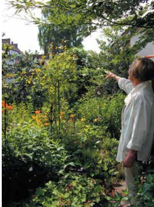
Blick in den Naturgarten

Die Eigentümerin eines Grundstücks in der Burgstraße zeigt ihren rund 140 m 2 großen naturnahen Garten mit heimischen Pflanzen. Ein Sitzbereich lädt zum Entspannen, Sonnenbad nehmen oder einfach miteinander reden ein. Dabei fällt der Blick auf eine große Sammlung von vielen kleinen Kieselsteinen. Sie sind Mitbringsel und Andenken von Reisen aus der ganzen Welt. Eine schöne Idee – Zuhause sein, wo es am Schönsten ist und dennoch ab und zu an schöne Reisen und Erlebnisse zurückdenken. Wenn sich bei Ihnen auch ein Blick in den Garten lohnt, wenden Sie sich an das Stadtumbaumanagement oder kommen Sie gern zum Treffen der Redaktionssitzung (weitere Informationen s. Termine).