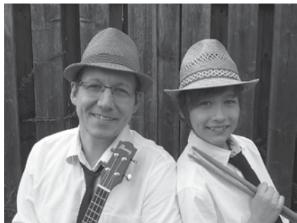
Das Vater-Sohn-Gespinn Zwiebelrenner spielt „Musik für junges Gemüse“.