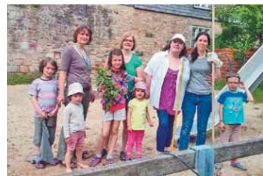
Da verschwand so manches Unkraut, denn alle packten mit an.