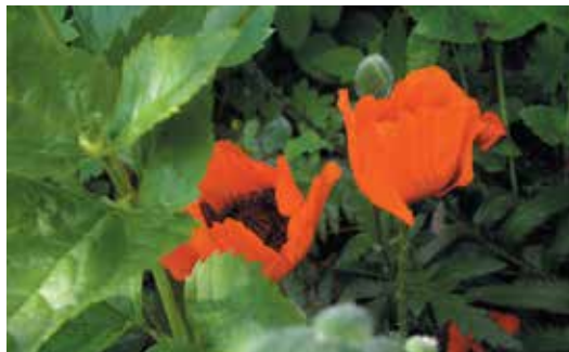
Heimische Pflanzen bereichern den Garten