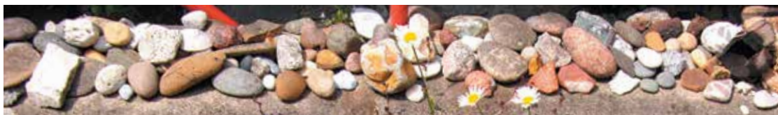
Steine aus aller Welt