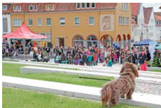
Ein Vierbeiner betrachtete das bunte Treiben am Michaelishügel

Sogar den Vierbeinern hat es gefallen! Alles stimmte: Besucher, Aus- und Darsteller, Organisation und