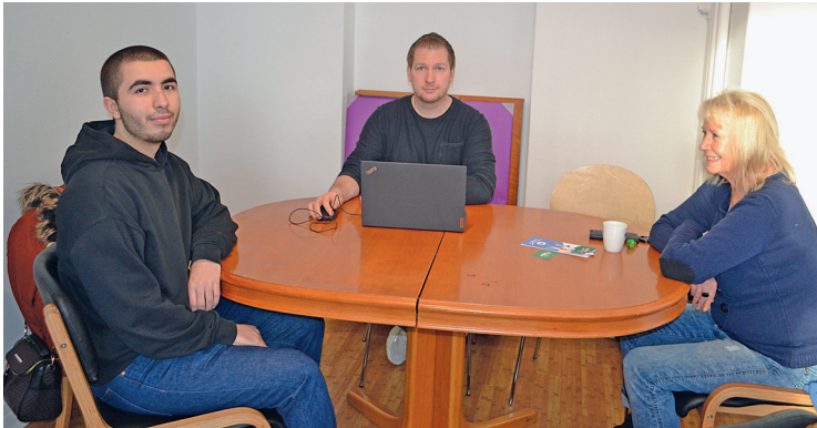
Jobcenter-Beratung beim Elternzentrum Ponto

Das Jobcenter Hildesheim bietet weiterhin Beratungen in der Nordstadt an. Fragen zur Vermittlung, Förderung und zum Leistungsbezug können beantwortet werden. Im Elternzentrum Ponto in der Peiner Straße 4 finden die Beratungen alle 14 Tage don-