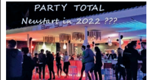
Unsere Wunschliste für 2022

älteren Generation. Warum nicht endlich mal das tun, worauf man schon immer Lust hatte? Immerhin sind die Jahre zwischen 20 und 50 genau so lang wie die Zeit zwischen 50 und 80. Dabei lehrt die Erfahrung, dass persönliche Freiheit ständig neu definiert, erkämpft und an die jeweilige Fitness sowie eigene Lebenssituation angepasst werden muss. Und da gibt es für Optimisten außer Kaffeefahrten, Gartenarbeit und Seniorenkreis noch so einiges mehr aktiv zu gestalten. Freiheit kann so viel bedeuten. Ohne Druck und Zwang handeln. Die Zeit frei gestalten und intensiver leben oder spontan verreisen, ohne dass jemand die Urlaubstage zählt. Sozial und ehrenamtlich etwas tun, was sich gut und richtig anfühlt. Es gibt unendlich viele Möglichkeiten.