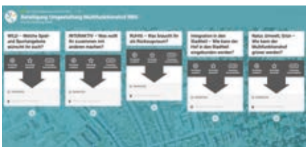
So sieht die Beteiligungswebseite aus.