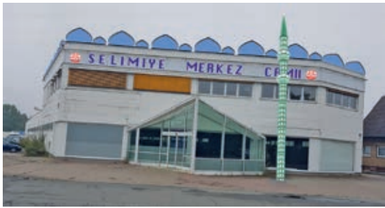
Nun steht es fest: Das ehemalige Medimax-Gebäude gehört nun der Selimiye-Moschee in Hildesheim.

Kurz vor Redaktionsschluss können wir den gigantischen Schritt für die Geschichte der Selimiye-Moschee mitteilen.