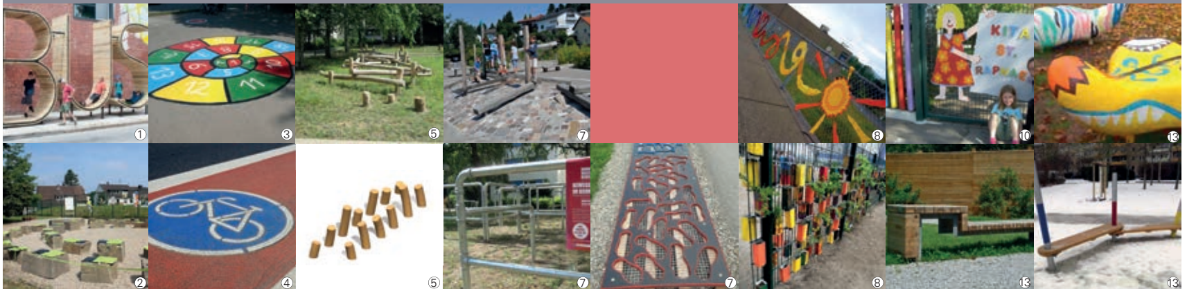
Die hier gezeigten Bilder sind Beispielbilder, die endgültigen Bewegungs- und Sitzmöglichkeiten werden noch im Detail abgestimmt.

Die Justus-Jonas-Straße wurde erfolgreich für den Autoverkehr gesperrt. Die damit einhergehende Verkehrsberuhigung dient vor allem dem fußläufigen Verkehr und dem Radverkehr. Die derzeitige Gestaltung der Eingangsbereiche zu Grundschulen und Hort sowie des Wegs reagiert nicht in angemessener Weise auf die neue Situation. Deswegen soll der „Schwarze Weg“ zu einem „Bunten Weg“ umgestaltet werden. Bei der Neugestaltung werden die Aufenthaltsqualität gesteigert und die Wegebeziehung gestärkt. Die ehemalige Wendeschleife wird zu einem Bewegungs- und Treffpunkt umgestaltet. Um das Thema Schule aufzugreifen, werden hier beispielbare Buchstaben- und Zahlenskulpturen installiert. Der Weg soll künftig insgesamt breiter ausgeführt sein, sodass jeweils eine verschiedenfarbig markierte Spur für Fußgängerinnen