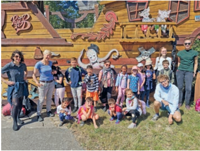
Ausflug in den Familienpark Sottrum

Zunächst aber werden die kleinen Hexen und Zauberer für fünf Tage in die Marien-