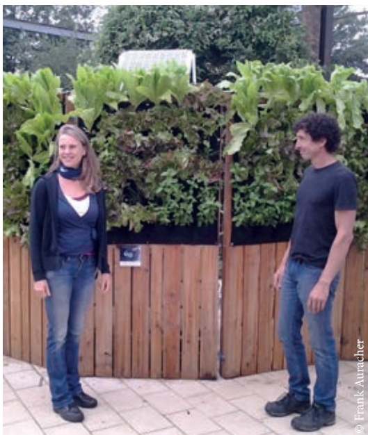
Das Team von Verticalix hat die Salatwand gebaut und aufgestellt.

Viele Hinterhöfe in der Nordstadt sind versiegelt. Es gibt keine Bäume und keine Pflanzen. Wo sollten sie auch Wurzeln schlagen? Insbesondere jetzt im Sommer, heizen sich diese Flächen besonders stark auf. Was könnte man also tun?