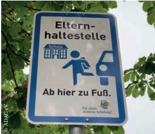
So wird das Verkehrsschild aussehen.

Für alle Kinder, die mit dem Auto in die Justus-Jonas-Straße gefahren werden müssen, werden Hol- und Bringzonen eingerichtet. Hier können Eltern ihre Kinder sicher aus dem Auto ein- und aussteigen lassen. Für die Ganztagsgrundschule Nord, die Grundschule Johannesschule und den Hort Nordwind werden zwei Hol- und Bringzonen in der Peiner Straße eingerichtet. Sie werden sich auf Höhe des Gemeindehauses sowie auf der gegenüberliegenden Fahrbahnseite befinden. Für die Kinder des Familienzentrums MaLuKi wird die Hol- und Bringzone in der Martin-Luther-Straße (vor der Kirche) sein. Die Elternhaltestellen werden mit dem oben abgebildeten Schild gekennzeichnet.