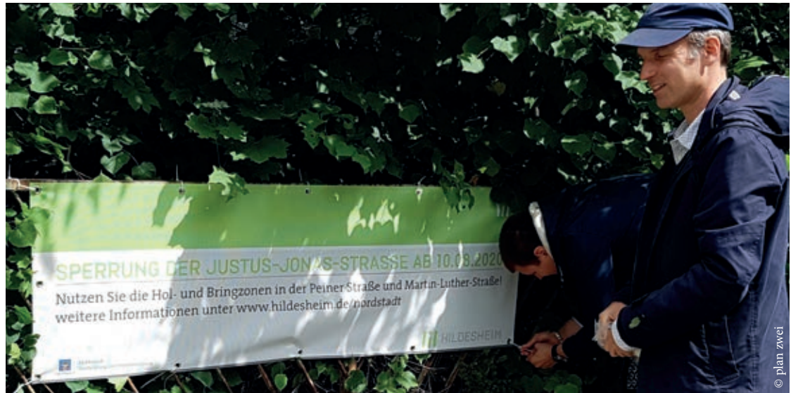
Zwei Mitarbeiter des Fachbereichs Stadtplanung und Stadtentwicklung bringen die Banner an.

mit dem Auto in die Justus-Jonas-Straße fährt, muss mit einem Bußgeld rechnen! Die Polizei wird hier regelmäßig kontrollieren. Damit bereits heute alle informiert sind, wurden Banner an der Einfahrt zur Justus-Jonas-Straße und am sogenannten „Schwarzen Weg“ aufgehängt.