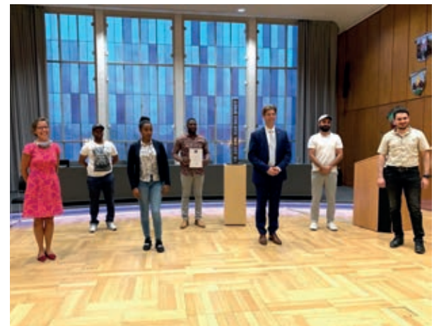
FLUX erhielt 2020 den Hildesheimer Friedenspreis