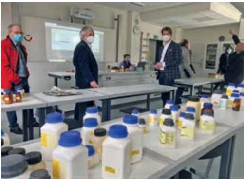
Rundgang durch den neuen Fachraum Chemie.