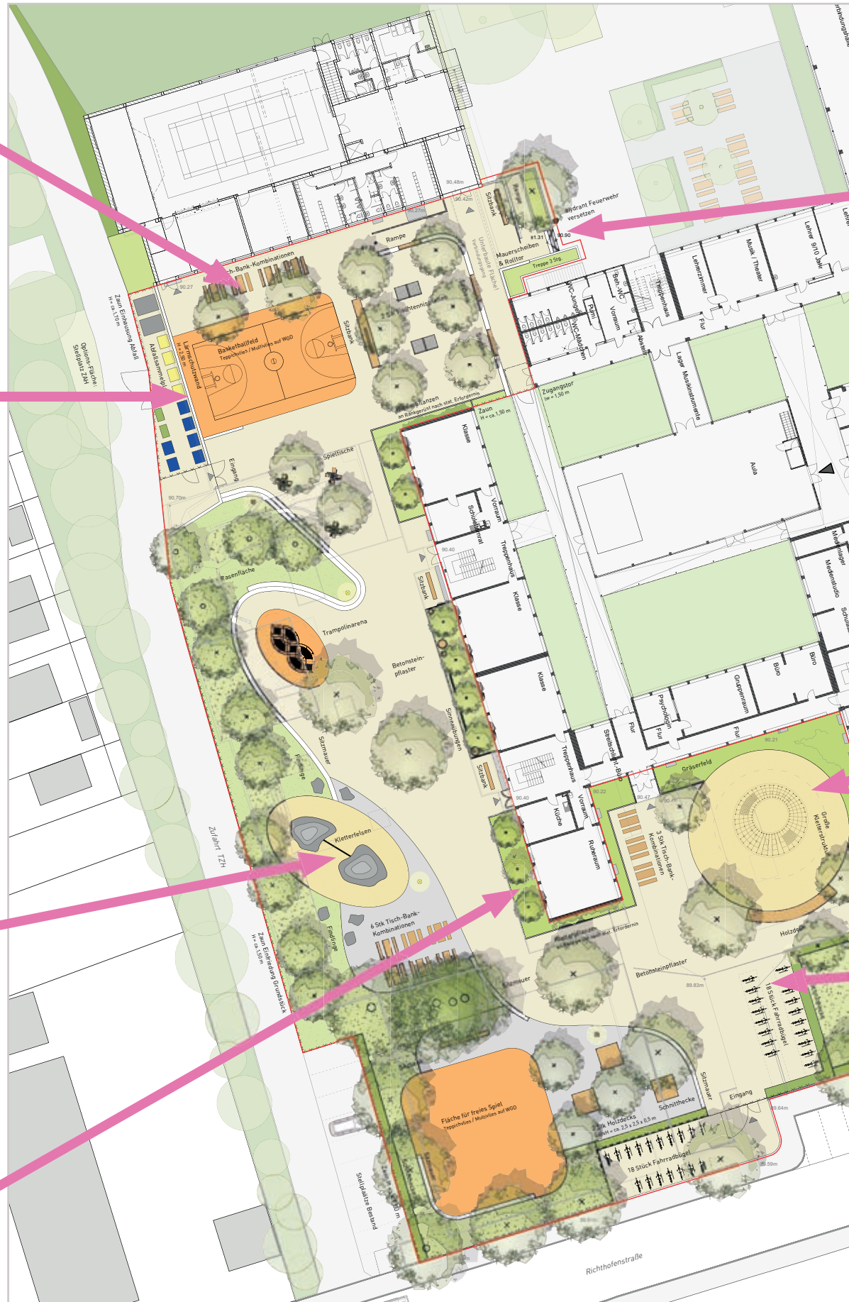
Vorabzug der Freianlagenplanung

Die Klassenräume heizen sich im Sommer schnell auf. Deswegen sollen vor der Fassade hohe, schlanke Bäume gepflanzt werden. Sie werden dazu beitragen, dass die Klassenzimmer hell und kühl sind.