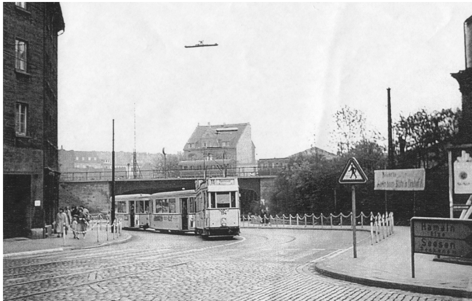
Auf der Steuerwalderstraße fuhr noch 1958 mit dem Tw 194 einer der 1928/29 in Dienst gestellten Stahlwagen mit den Beiwagen 1052 und 1053 vom Hildesheimer Hauptbahnhof kommend.

Diese Frage drängt sich wohl jedem Besucher beim Anblick der Steuerwalderstraße auf.