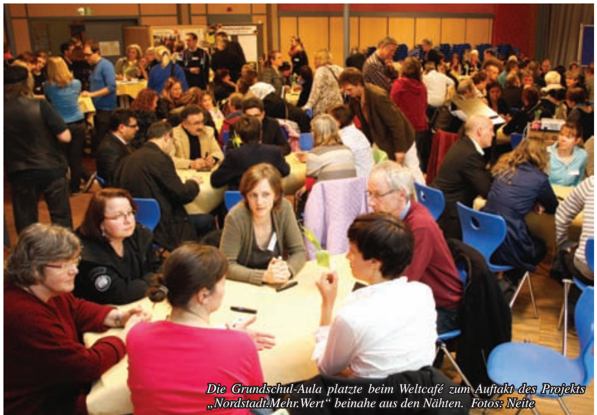
Die Grundschul-Aula platzte beim Weltcafé zum Auftakt des Projekts „Nordstadt.Mehr.Wert“ beinahe aus den Nähten.