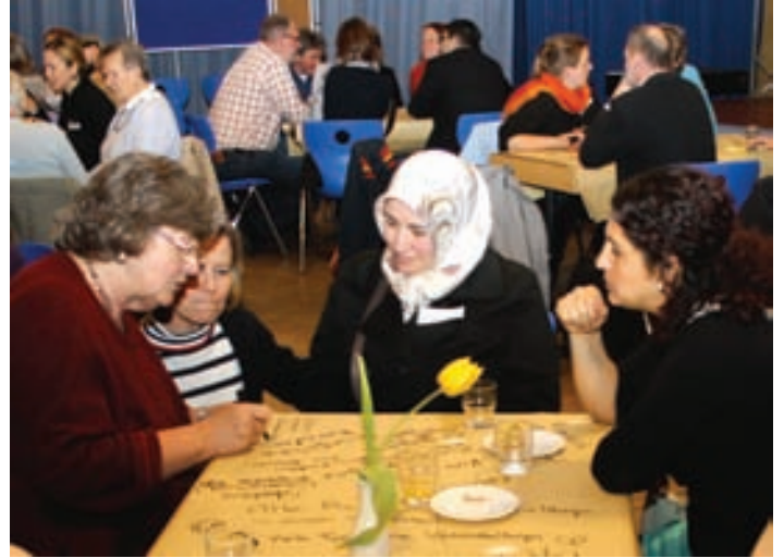
Tischdecken als Notizzettel – die TeilnehmerInnen konnten ihren Fantasie freien Lauf lassen.

Das Zusammenkommen vieler Kulturen, gute Einkaufsmöglichkeiten, kurze Wege, die Einfachheit und Natürlichkeit der Menschen, Grünflächen und Spielplätze wurden besonders häufig notiert. Auch zu den beiden anderen Kernfragen, welche Vorzüge erhalten bleiben sollen und wie sich das Viertel weiterentwickeln könne, kamen zahlreiche Vorschläge: Gemeinsame Feste, größere Netzwerke, ein Café als zentraler Treffpunkt, die Einrichtung eines Wochenmarktes, Kreativ- und Kulturprojekte, zusätzliche Bildungs- und Freizeitangebote beispielsweise – aber auch „weniger Müll, weniger Zerstörung, mehr Sauberkeit“. Die