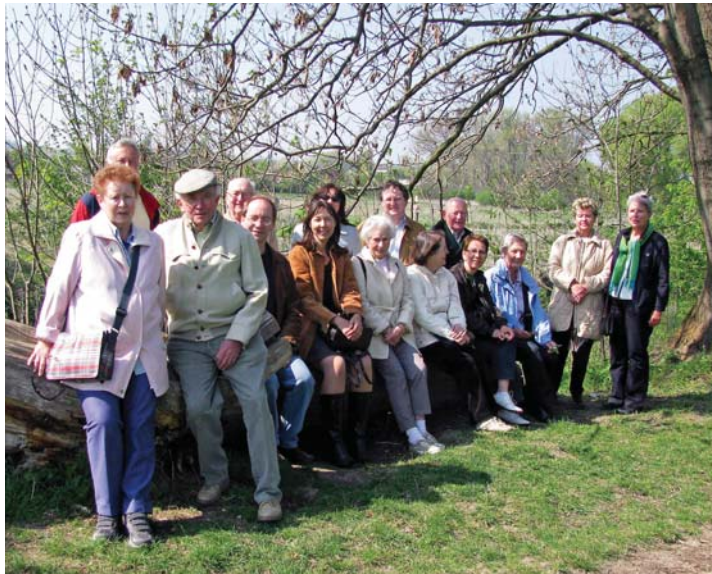
Die Teilnehmer bei einer kurzen Rast im Grünen