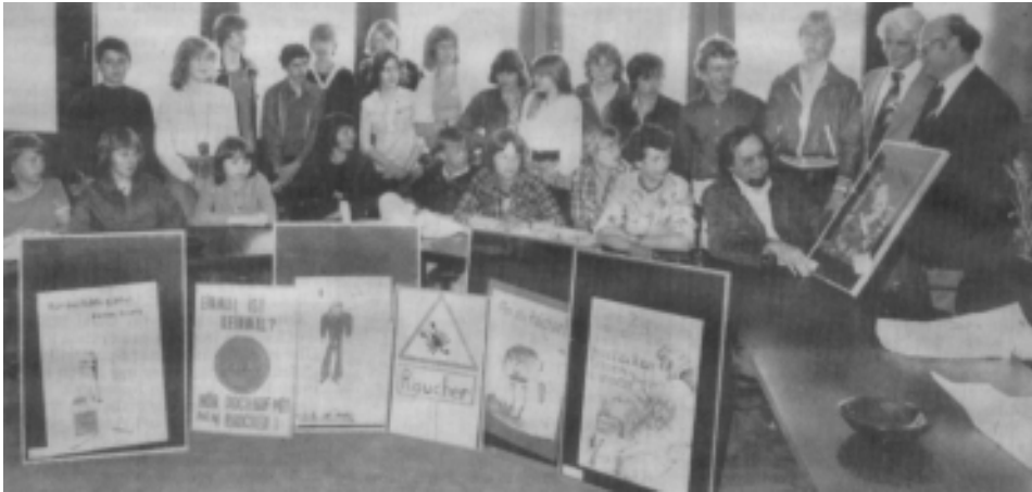
Engagiert Lernen für das Leben: Bilder aus der Geschichte der Robert-Bosch-Gesamtschule sind voll von Beispielen. Vor Jahren so aktuell wie heute – Posterentwürfe für eine Anti-Raucher-Kampagne.