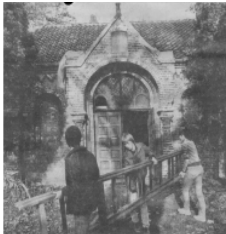
Umgang mit dem Erbe der deutschen Geschichte: Die AG Beth Shalom bei der Restaurierung des jüdischen Friedhofs.

Und das spiegelte sich dann auch in den Fernsehstatements von Schülern wieder, die aussagten, dass an dieser Schule das Ler-