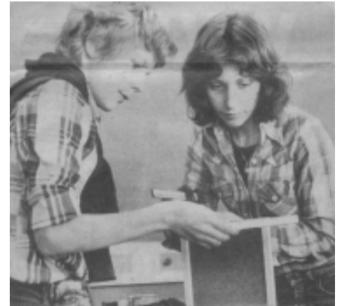
Vorbereitung auf das Beruffleben: Gründung von einer Firma und der Umgang damit.

schen Kämpfe um und gegen die junge Schulform Gesamtschule hautnah miterleben und sich in Form von Demonstrationen vor dem Rathaus Gehör verschaffen konnte. Dabei traten konservative (Gymnasium, Realschule, Hauptschule) gegen moderne Politikinteressen gegeneinander an, und es war eines immer deutlich zu spüren: Kritikfähigkeit und die Hinterfragung bestehender Werte auf ihre Berechtigung wurden