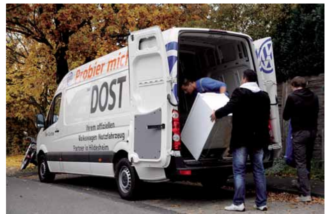
Mitarbeiter von Caritas und Dost verstauen einen alten Kühlschrank. Sein Ziel: die Deponie.

Natürlich geht dies nur mit Hilfe vieler Sponsoren: Die Firma Hagebaumarkt beispielsweise stellt die Kühlgeräte bereit. Und das Autohaus Dost transportiert diese dann zu den Empfängern, nimmt die alten Kühlschränke mit und bringt sie anschließend zur Deponie. „Uns ist wichtig, dass die alten Geräte fachge-