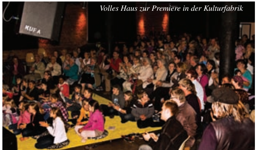
Volles Haus zur Premiere in der Kulturfabrik