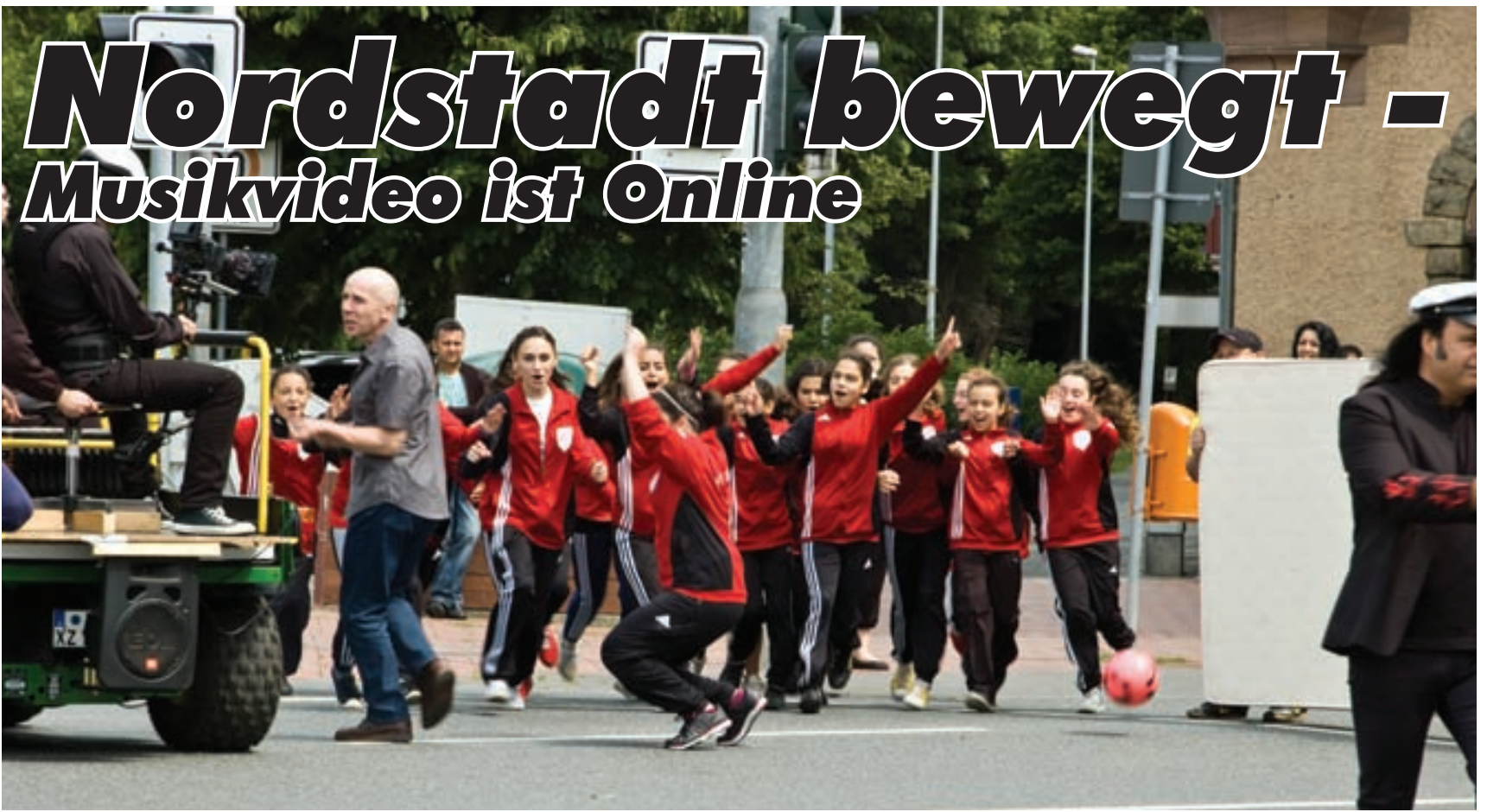
Der Käpt'n und die Mädchen von Türk Gücü auf der gesperrten Sachsenring-Kreuzung