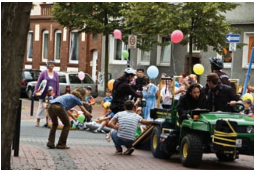
Rasante Kamerafahrt, im Hintergrund die Kita Nordlicht im Taucherlook