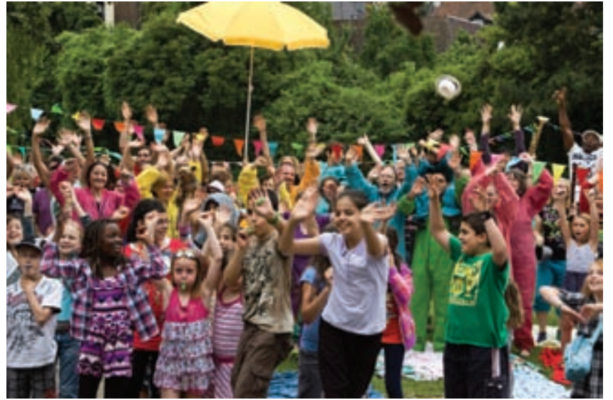
Hochstimmung im Park, in zweiter Reihe das Team von Nordstadt.Mehr.Wert