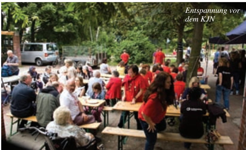
Entspannung vor dem KJN