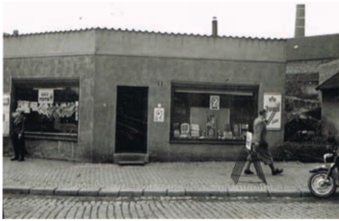
Der Flachbau aus den 1950er Jahren.