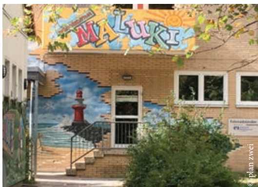
Das Familienzentrum MaLuKi ist eine wichtige Anlaufstelle.