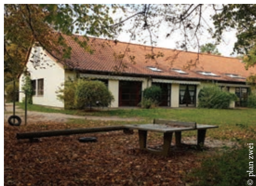
An diesem Gebäude soll der Anbau errichtet werden.