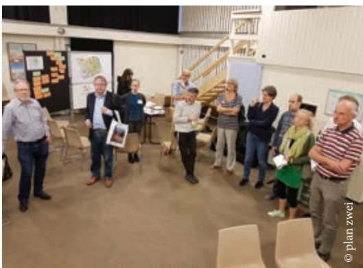
Die Teilnehmenden des Stadtteilforums diskutierten die Bedeutung der Freiflächen und der (Wege-)Vernetzung.

Außerdem wurden zahlreiche Zettel ausgefüllt, die auf dem Straßenfest und über Vereine sowie Initiativen im Stadtteil verteilt wurden. Vielen Dank an alle, die sich eingebracht haben und deren Informationen somit ins Freiraumentwicklungskonzept einfließen!