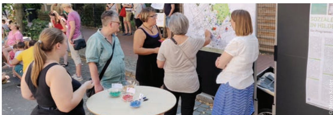
Viele Bürgerinnen und Bürger markierten während des Straßenfestes, welche Freiräume ihnen in der Nordstadt gefallen und welche nicht gefallen.