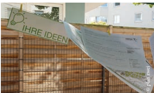
Während des Stadtteilfestes wurden Ideen für die Entwicklung der Freiflächen in der Nordstadt gesammelt.