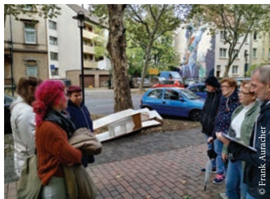
Während des Stadtteilspaziergangs wurde auf gute und verbesserungswürdige Freiräume hingewiesen.