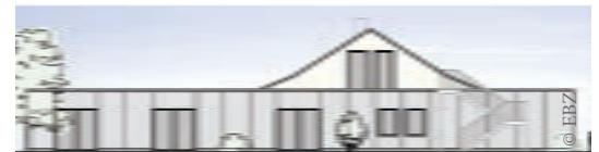
Anbau: Ansicht Martin-Luther-Straße

Zum anderen kann durch die Förderung eine neue Personalstelle geschaffen werden. Bisher standen für die Koordination des Familienzentrums zehn Wochenstunden zur Verfügung. Zukünftig können die Schnittstellenaufgaben für die integrative Arbeit in der Nordstadt ausgeweitet werden.