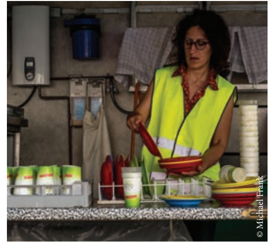
Abwasch des Mehrweggeschirrs im Spülmobil.

Erstmals kam das neue Geschirr beim Nordstadt-Fest zum Einsatz. Dazu wurde sogar eigens ein Spülmobil ausgeliehen und erfolgreich getestet.