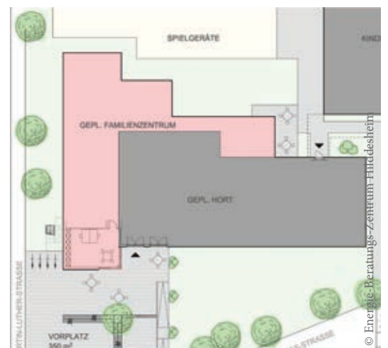
Auf dem Grundriss ist der Erweiterungsbau (rot eingefärbt) erkennbar.