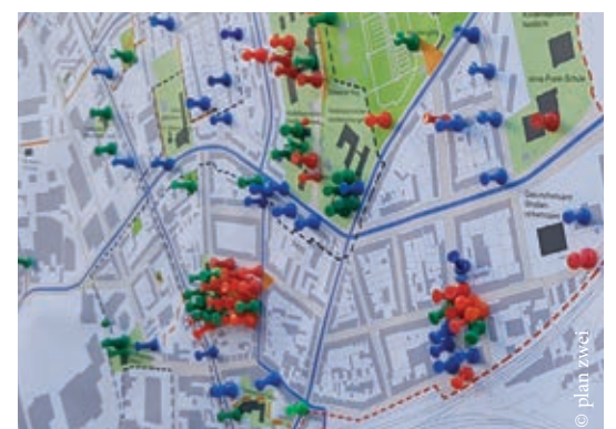
Die große Bedeutung des Friedrich-Nämsch-Parkes wurde deutlich.