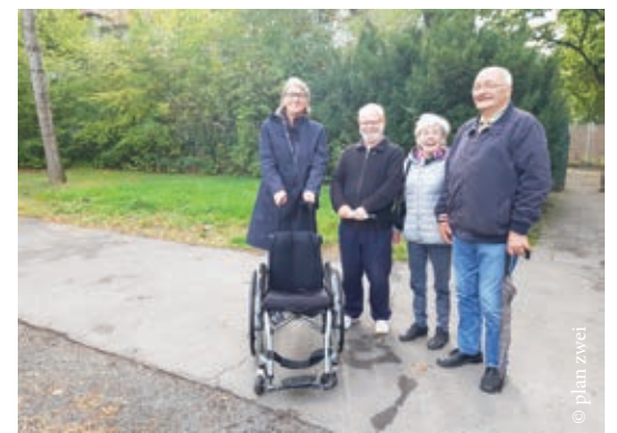
Die Teilnehmenden probierten aus, wie es ist, sich in einem Rollstuhl durch die Nordstadt zu bewegen und wie anders der Blickwinkel ist.