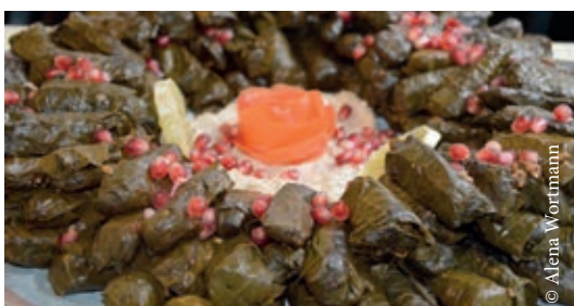
Frisch gerollte Weinblätter mit Granatapfelkernen.