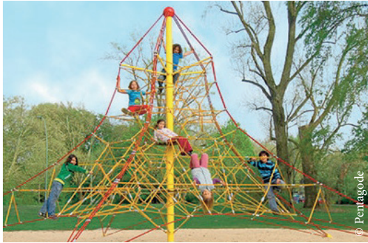
Auf so eine Kletterspinne dürfen sich die Grundschul Kinder freuen.

Der Rat der Stadt Hildesheim hat entschieden: Teile der Schulhofflächen der beiden Grundschulen in der Justus-Jonas-Straße sollen saniert werden. Bis es damit losgehen kann, ist es aber noch ein langer Prozess. Das Projekt muss vom Bund und Land genehmigt werden, die schriftliche Zusage muss erfolgen und erst dann kann geplant werden. Vor 2022 wird es wohl kaum losgehen können. Aber bereits in diesem Jahr soll schon etwas passieren. Unabhängig von der großen Maßnahme, konnte die Stadt Hildesheim in Zusammenarbeit mit den Grundschulen die Anschaffung zwei neuer Spielgeräte ermöglichen. In den Sommerferien sollen auf der Schulhoffläche ein Kletterturm und eine Drehscheibe entstehen. Die Drehscheibe gibt es bereits auf dem Scharnhorsthof in der Oststadt und sie erfreut sich dort großer Beliebtheit! Der Kletterturm soll die Bewegung und Motorik der Kinder fördern und ist sicherlich für die Kleinsten eine besondere Herausforderung, da es immerhin in fünf Meter Höhe hinaufgeht! Zum Schuljahresbeginn im August sollen die neuen Geräte an der Schule aufgestellt sein.