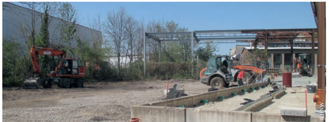
So kann es bald auch auf dem Spielhof des Go20-Zentrums aussehen!

Mitte 2016 hat das Programm Soziale Stadt in der Nordstadt begonnen. Jetzt, im April 2020, rollt endlich der erste Bagger! Nach einer Planungszeit von mehr als einem Jahr haben die Bauarbeiten für den neuen Go20-Spielhof an der Kita im Bischofskamp begonnen. In den nächsten Monaten wird hier zunächst der Spielhof hergestellt, im Anschluss dann noch eine sog. „grüne Fuge“ vor der Kita gebaut.