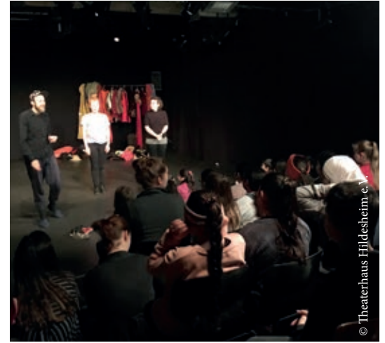
Kinder der Grundschule besuchen das Theaterhaus.

Die Grundschule Nord hat eine Aufführung der Improvisationstheatergruppe „Schmidt’s Katzen“ im Theaterhaus besucht. Dank der Förderung durch den Verfügungsfonds konnten 242 kleine und große Gäste Theaterluft schnuppern. Wie angekündigt ging es auf eine wilde Reise zu noch unentdeckten Geschichten – nach Vorschlägen der Kinder wurde in Szene gesetzt, erzählt und besungen. Das Erlebnis wurde vorbereitet und danach pädagogisch ausgewertet. Kulturelle Unterschiede wurden spielerisch überbrückt und alle waren stolz darauf, dass sie die Handlung mitbestimmen konnten.