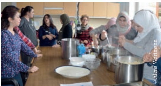
Gemeinsam kochen macht Spaß und gemeinsam essen erst recht!

Die Weltküche findet statt im Gemeindehaus Martin Luther in der Peiner Str. 53, ab 13:00 Uhr am 20.4., am 25.5., am 15.6. und am 13.7.2020.