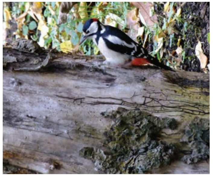
Der Specht wird nicht da sein, wenn Besucher kommen. Aber er ist ein Stammgast in diesem Garten.

Stelle berichtet haben, wird an diesem Tag mit 20 Prozent Rabatt und Signatur zu haben sein. Kaffee und Mineralwasser werden für einen kleinen Obulus angeboten. Anmeldungen erwünscht, aber nicht erforderlich: Tel. 051 21 - 51 94 94.