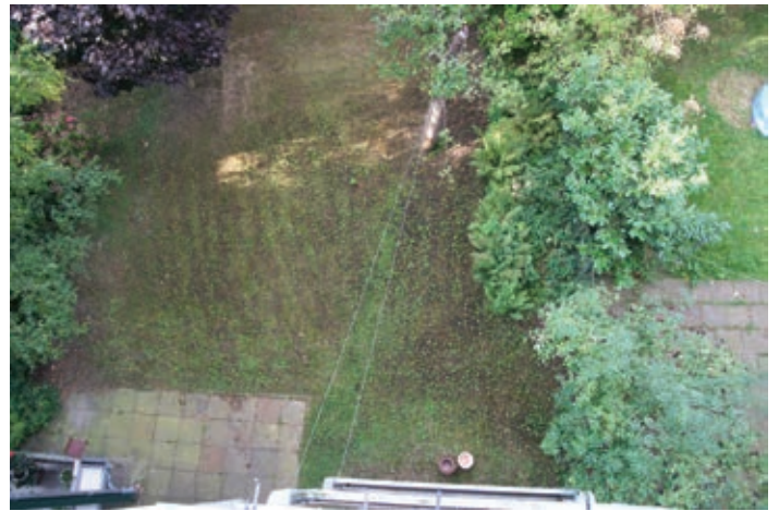
In diesem Garten werden am 21. Juli Flohmarkt-Angebote aufgebaut.