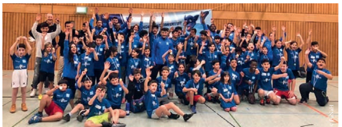
Insgesamt haben über 200 Kinder, Jugendliche und Erwachsene an dem Turnierwochenende mitgewirkt.

Beide Turniertage waren geprägt von einem tollen und fairen Umgang untereinander! Nach dem Turnier wurden alle Teilnehmerinnen und Teilnehmer geehrt und somit haben am Ende alle gewonnen!