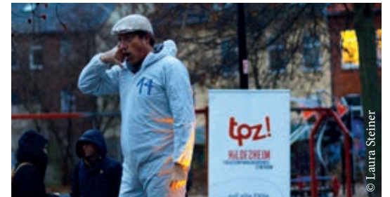
Live Performance beim Nordstadt Clash

Menschen sich besonders wohlfühlen, sei es der Kiosk um die Ecke oder eine bestimmte Parkbank: Wenn Sie einen Wohlfühlort in der Nordstadt haben, senden Sie diesen gerne mit Adresse und einem kurzen Text, warum dieser Ort für Sie eine besondere, persönliche Bedeutung hat, an utopolis@tpz-hildesheim.de oder rufen Sie in der Geschäftsstelle an unter 05121 / 314 32.