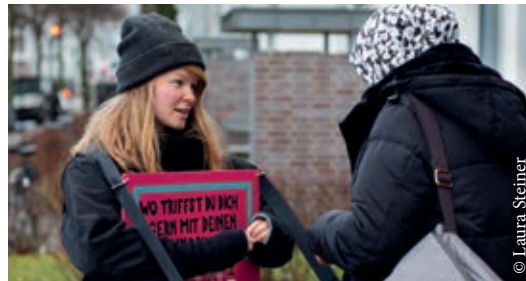
Befragung: „Wo triffst du dich gern mit deinen Freundinnen und Freunden?“

Einrichtungen des Stadtteils angeknüpft. In enger Zusammenarbeit mit dem sozialplanerischen Quartiersmanagement erstellt das TPZ derzeit eine Soziale Straßenkarte der Nordstadt. Das Besondere: auch hier können Bewohnerinnen und Bewohner sich beteiligen. In die Onlinekarte werden neben öffentlichen Einrichtungen und Anlaufstellen des Stadtteils auch Orte eingetragen, an denen