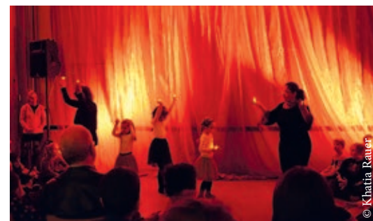
Die Kinder der Tanzgruppe vom SV Türk Gücü zeigen, was sie können.