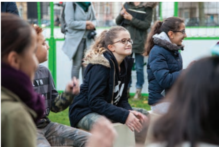
Die Trommelgruppe der Caritas hat sich gerade erst gegründet. Trotzdem sind die Jungen und Mädchen schon bereit für den ersten Auftritt.

deckt. Dann treffen sich bis zu 60 Menschen aus dem Stadtteil zum gemeinsamen Essen. Dafür braucht es kein Catering. „Jeder bringt etwas zu Essen mit. Wir kaufen nichts dazu“, erklärt