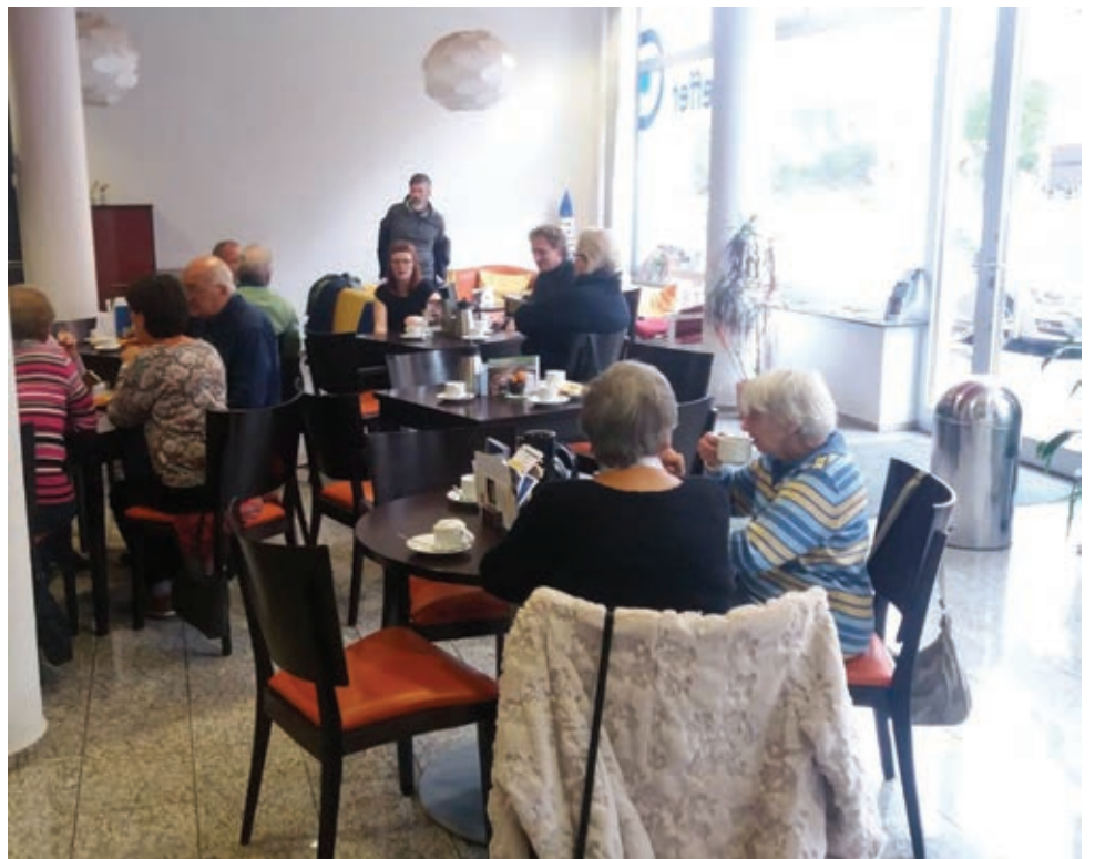
Erzähl-Café im Oktober 2018