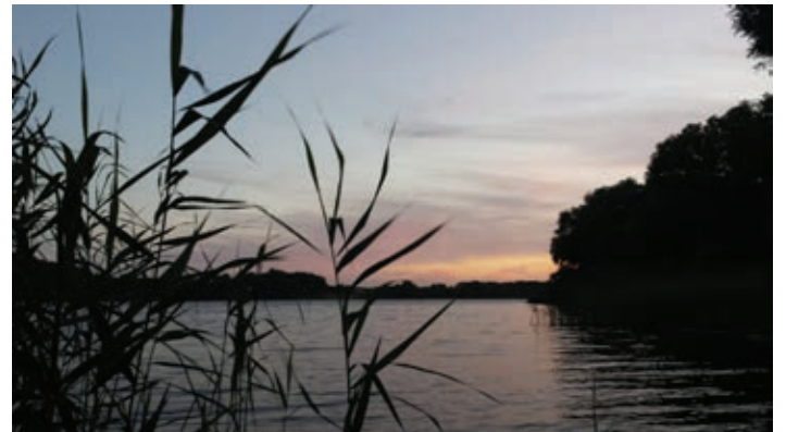
Abendstimmung am Goldensee

Gemeinschaftszimmer und waren stets mitten im Geschehen. Schon der morgendliche Gang in Richtung Duschaum war begleitet von Begegnungen mit Kindern, Berichten über Befindlichkeiten, Träume oder Anliegen. Und bis des Abends das Vorlesen und Erzählen in den Zimmern beendet, Mückenstiche behandelt, blaue