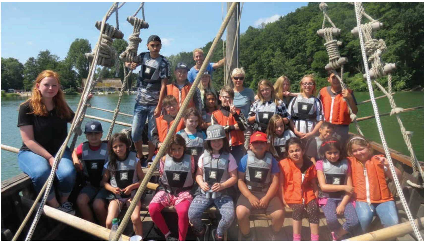
Törn auf dem Wikingerschiff