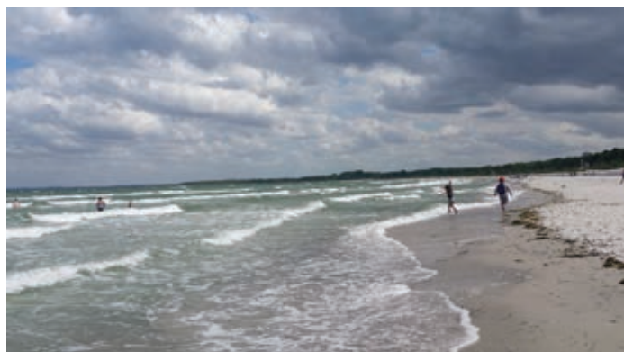
Dramatischer Himmel über der Ostsee

In dieser Umgebung brauchte es eigentlich nur noch gutes Wetter, um eine tolle Woche zu verbringen. Das Schönste war für die Kinder sicher der Badespaß im See.