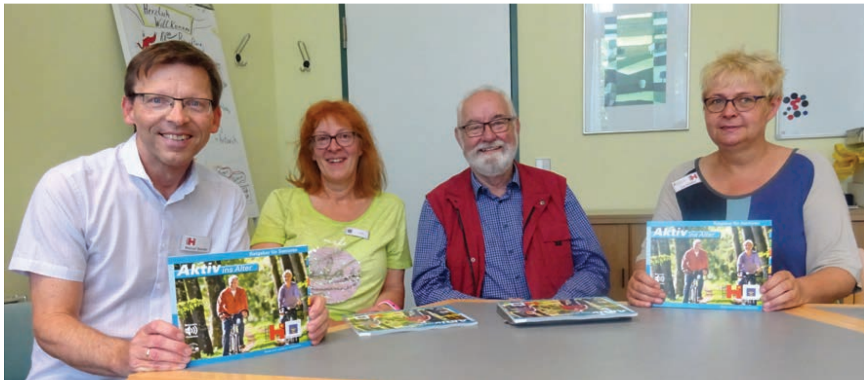
Das Redaktionsteam präsentiert den neuen Ratgeber für Senioren.

Unter dem Titel „Aktiv ins Alter“ ist ab sofort die dritte gemeinsame Auflage des Seniorenratgebers der Stadt Hildesheim und des Landkreises Hildesheim erhältlich.