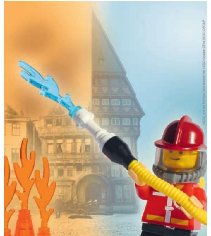
„Hildesheim fängt Feuer. Stadtgeschichte im LEGO® Format“ (05.11.2017–22.04.2018), LEGO und die Minifigur sind Marken der LEGO Gruppe