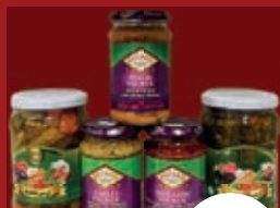
Eingelegtes Gemüse diverse Sorten, Glas ab / از 1,99