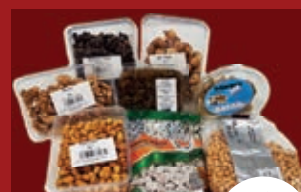
Orientalische Knabereien diverse Sorten ab / از 1,49