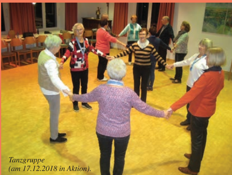
Tanzgruppe (am 17.12.2018 in Aktion).

Mit „Sport für Ältere“ lädt Eintracht Hildesheim ein. Angeboten werden u.a.