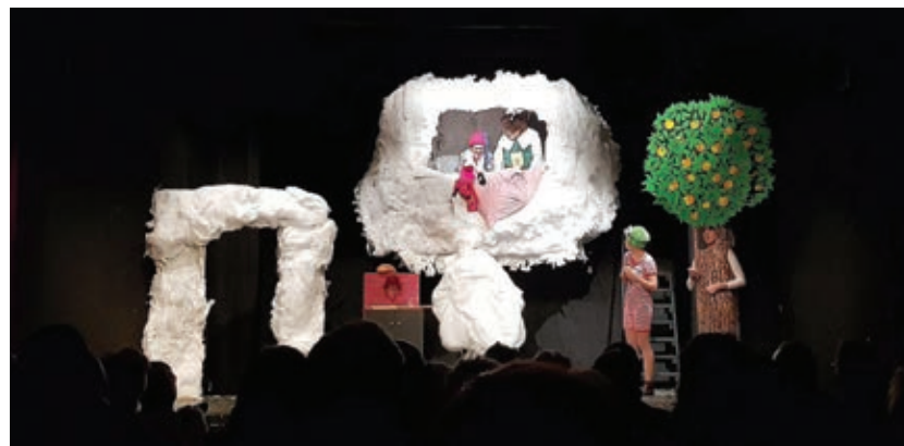
Hat Frau Holle ein Alkoholproblem? Hier gibt's neue Erkenntnisse zum Klimawandel.

Auch ihr Mann, Herr Holle ist da keine echte Hilfe. Hausarbeit ist eben nicht so sein Ding. Was Frau