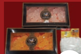
Persische Süßwaren diverse Sorten ab / از 2,49

فروشگاه مواد غذایی پارسیان عرضه کننده انواع محصولات ایرانی افغانستانی ترکی عربی هندی با بهترین کیفیت و نازل ترین قیمت در خدمت مشتریان