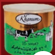
Butter Ghee 500g ab / از 5,99