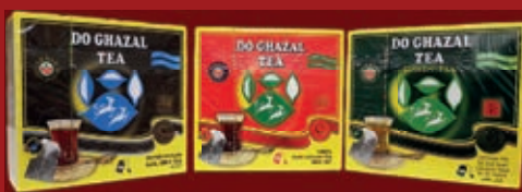
Do Ghazal Tea diverse Sorten, Packung ab / از 2,99