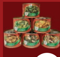
Konserven- gerichte ab / از 2,49