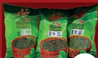
Getrocknete Kräuter diverse Sorten, Beutel ab / از 1,99