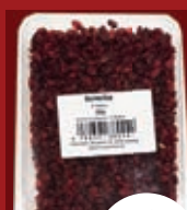
Berberitze Packung ab / از 1,99