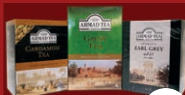
Ahmad Tea diverse Sorten, 500g ab / از 4,99