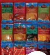
oriental. Gewürze ab / از 0,99