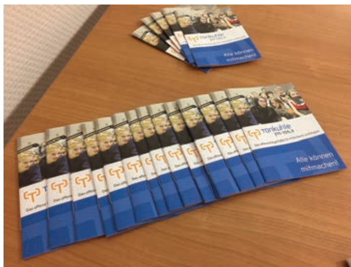
Die handliche Broschüre zeigt kurz und verständlich die Möglichkeiten zum Mitmachen bei Radio Tonkuhle.

Andere Teile der Spende sind in dringend notwendige Modernisierungsmaßnahmen geflossen. Nämlich neue Rechner, ein neuer Netzwerkservers mit einem neuen System darin sowie neue Monitore, um den Workflow innerhalb des Bürgersenders in der Andreas-Passage sowohl für die Nutzer als auch für die Mitarbeiter zu verbessern. Weiter Mittel sollen in 2017 in Renovierungsarbeiten gesteckt werden. „Wir möchten uns für die große Hilfe bei der Sparkasse Hildesheim bedanken, ohne die all diese Maßnahmen nicht möglich gewesen wären“, betont Kreichelt.