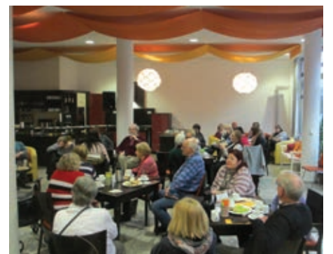
Die Gäste der Veranstaltung lauschen den Beiträgen.

Text: Sabine Howind