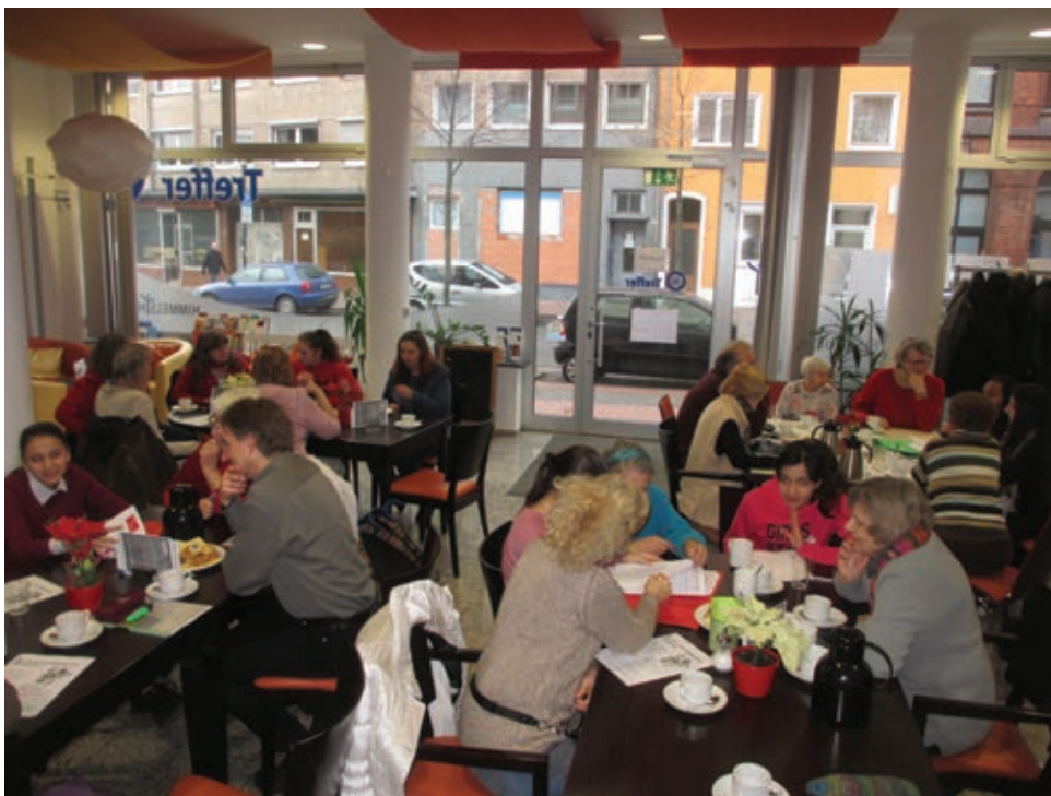
Schüler und Gäste im regen Austausch miteinander