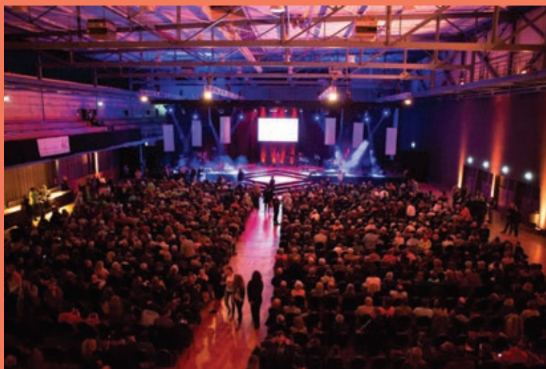
„Panorama 2016“