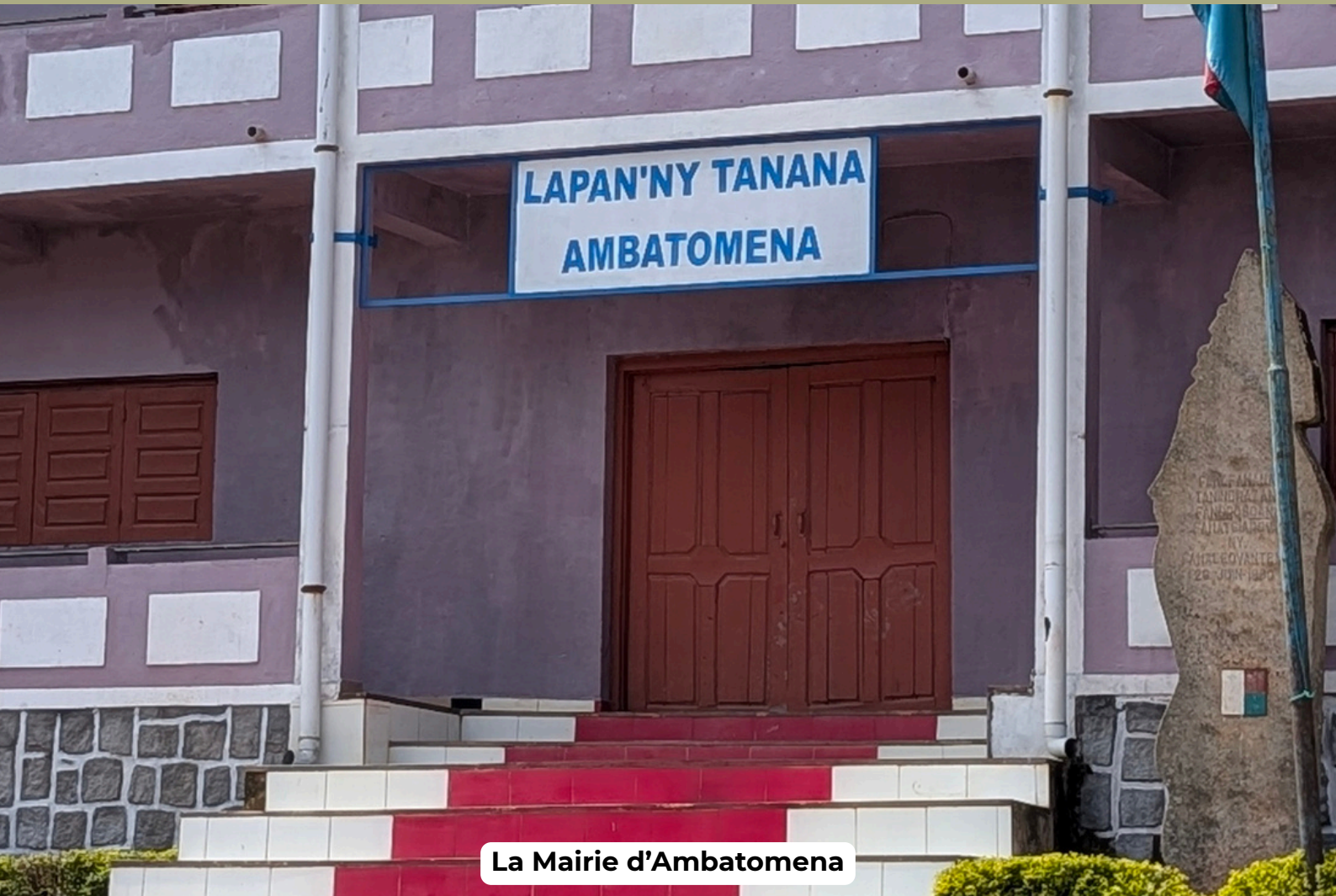
La Mairie d'Ambatomena

Située dans la commune rurale de Manjakandriana, au cœur de la région Analamanga, Ambatomena incarne la réalité de nombreux territoires où l'accès aux soins reste encore fragile.