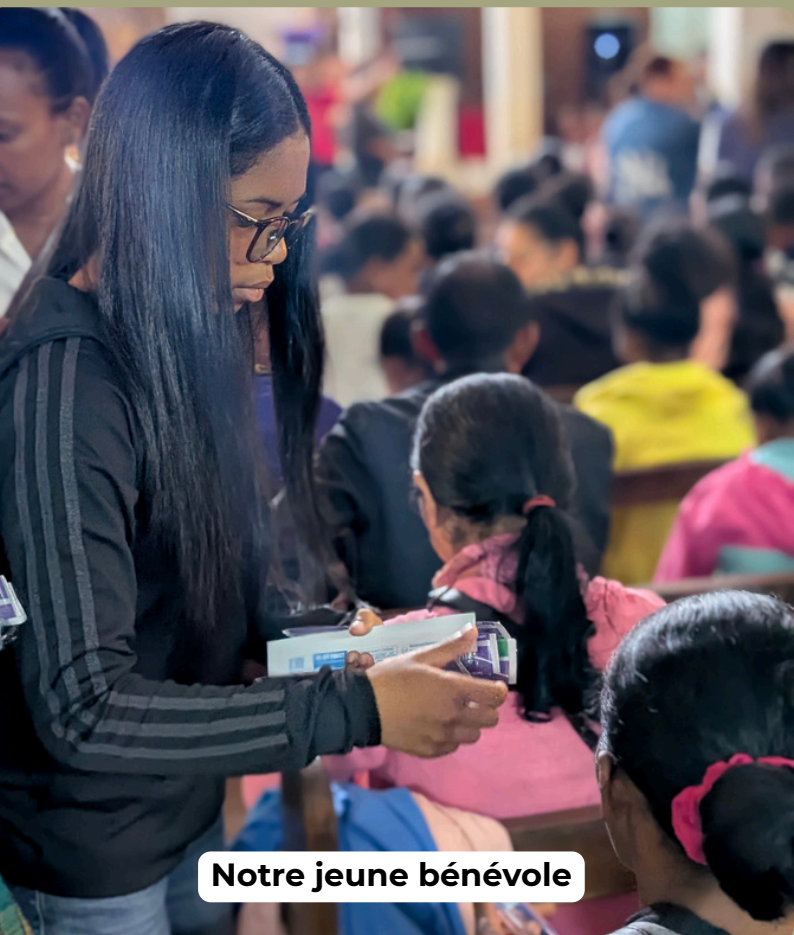
Notre jeune bénévole