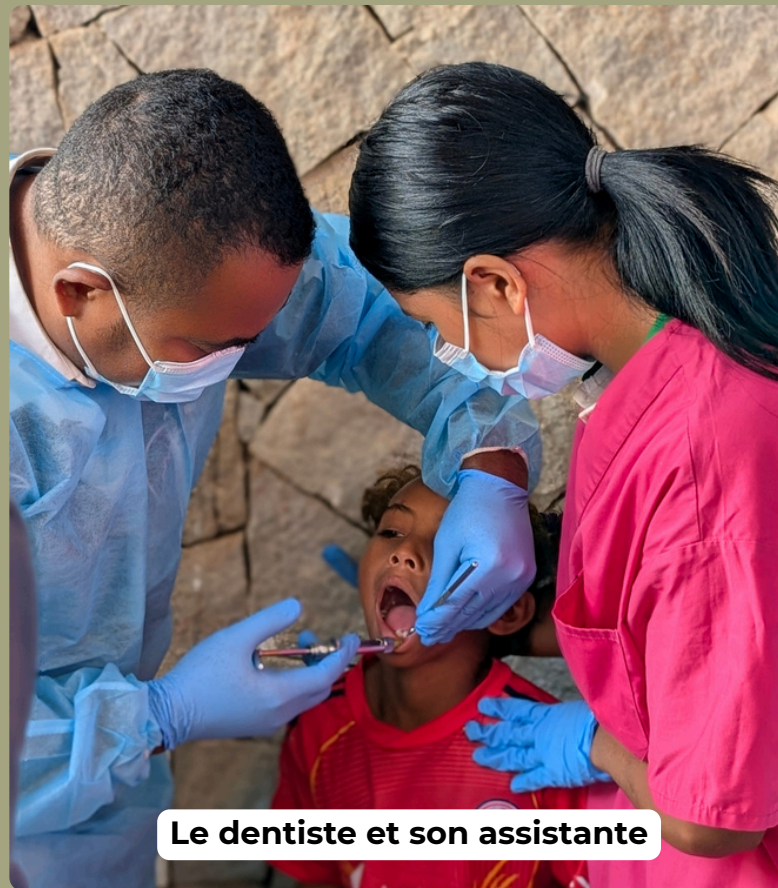
Le dentiste et son assistante

Améliorer l'accès aux soins bucco-dentaires pour les populations les plus démunies à Madagascar, à travers des actions de prévention, de sensibilisation et de prise en charge de proximité.