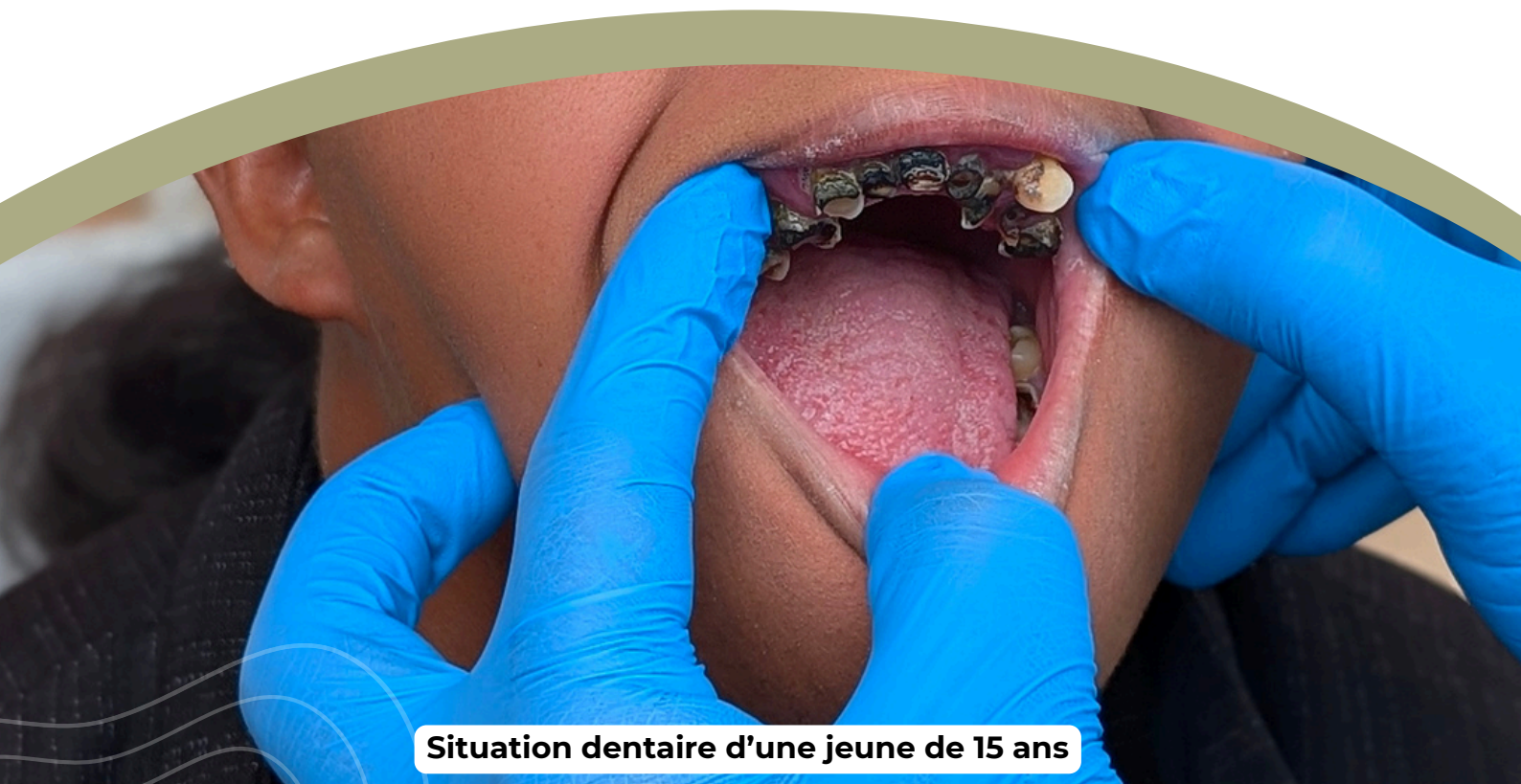
Situation dentaire d'une jeune de 15 ans