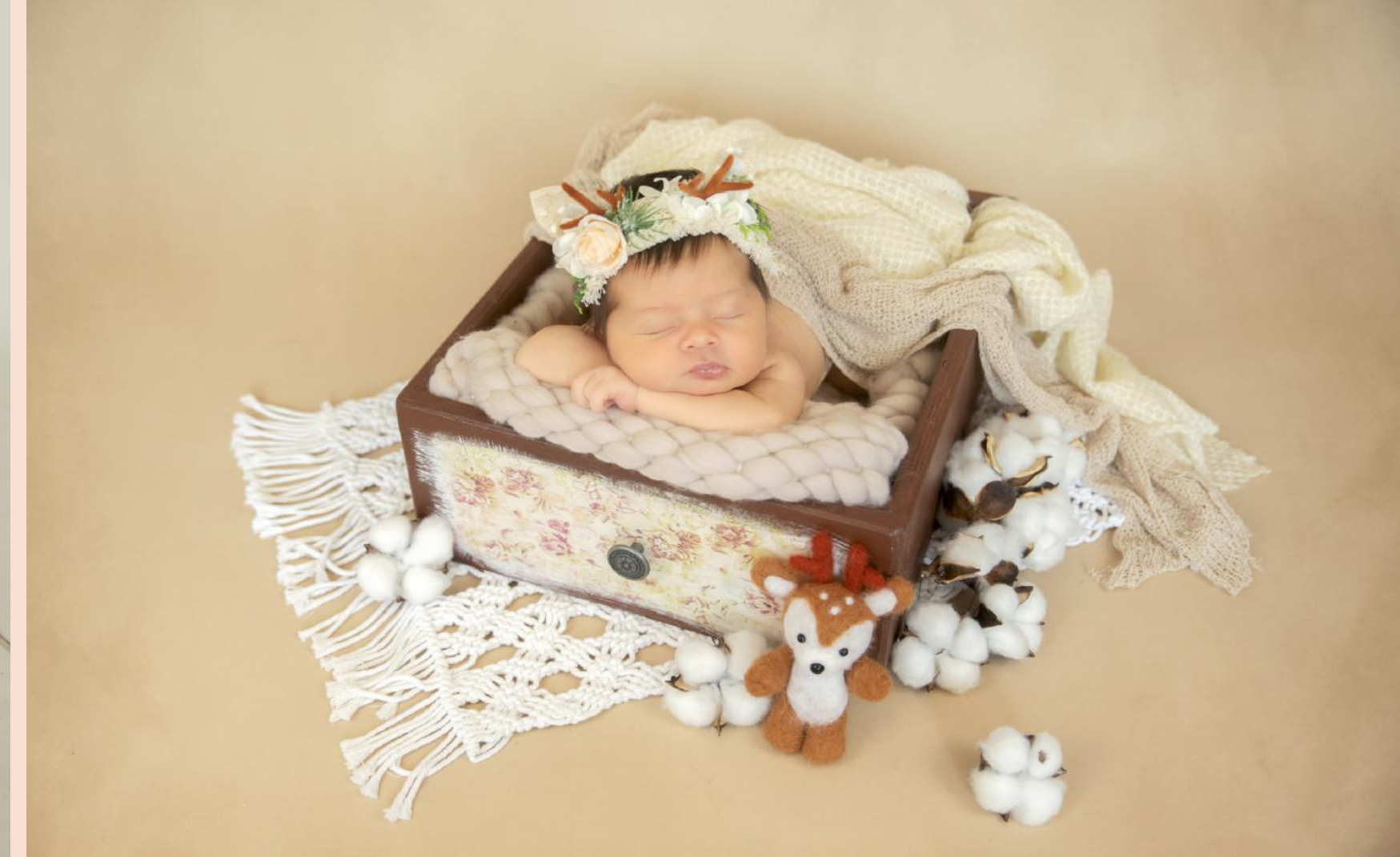
Caisse marron avec coeur ou fleurs