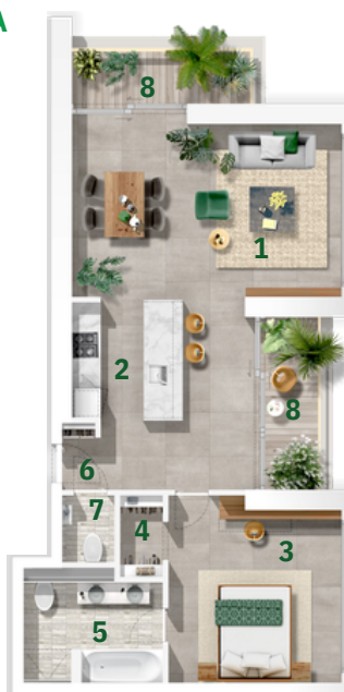
Types: 1-B Levels: T01 - T15