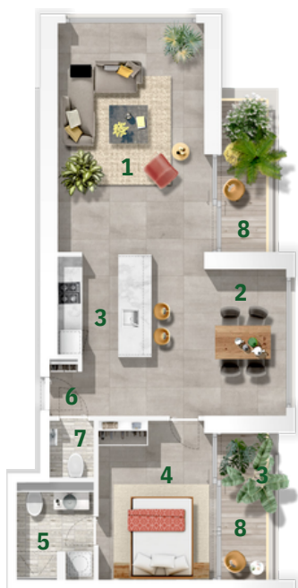
Types: 1-A Levels: T01 - T15