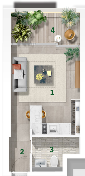
Types: S-B Levels: T01 - T09