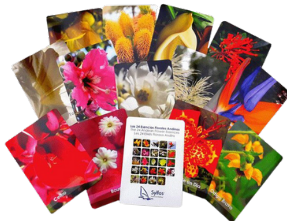
Baraja de cartas de diagnóstico de los 24 elixires florales andinos

Este elixir aporta paz y nos permite centrarnos en el «aquí y ahora», sin interferir en nuestra vida actual y nuestro estado de salud. Nos ayuda a romper los vínculos telepáticos no deseados con personas del presente o de vidas pasadas. Su acción permite mejorar la memoria, la visualización y desarrollar la atención y la presencia.