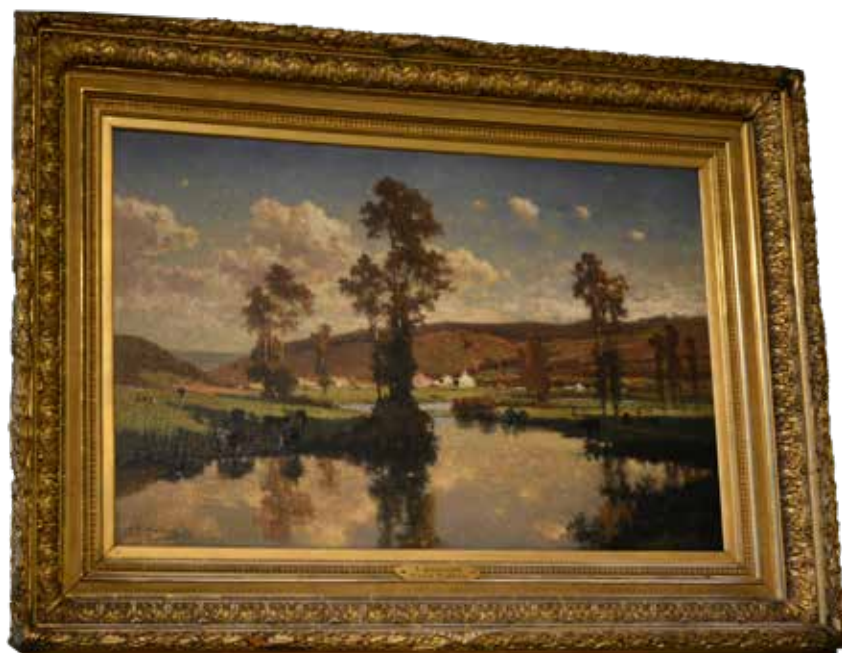
FRANCOIS ROFFIAEN Pays Wallon (106 x 142 cm).

Les peintures des collections communales exposées illustrent le plaisir de représenter le paysage des peintres qui sont nés ou qui sont passés dans la vallée mosane. Qu'ils soient originaires ou non de Namur, ces artistes ont en commun leur attachement profond à une tradition picturale romantique dans un premier temps, réaliste ensuite.