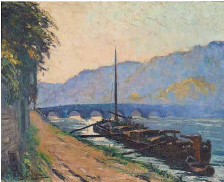
EUGÈNE COLIGNON Péniche en aval du pont de Jambes (63 x 76 cm).

Portés par leur art vers d'autres contrées qui les mettent au contact du modernisme, plusieurs vont en intégrer certaines pratiques par petites touches ou du moins s'y essayer.