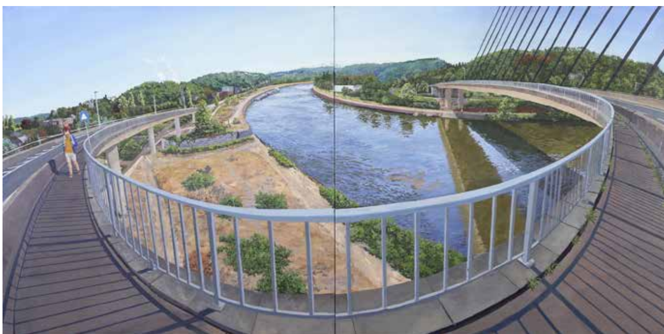
SIMON DELNEUVILLE Concrete, 2025, huile sur toile (70 x 140 cm).

Simon Delneuville vit et travaille depuis une dizaine d'années dans un village du Condroz namurois.