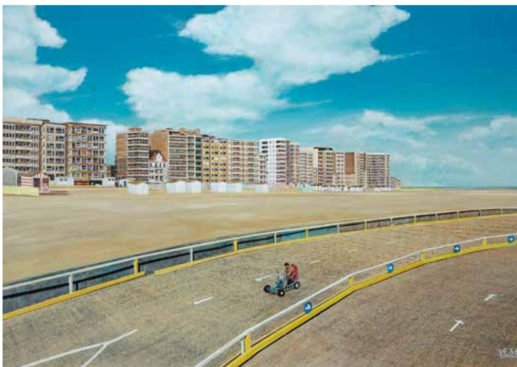
MICHEL PEETZ Images d'été, Autodroom, 2025, acrylique sur carton vergé (43 x 60 cm).

Il vit dans la région de la Basse-Sambre.