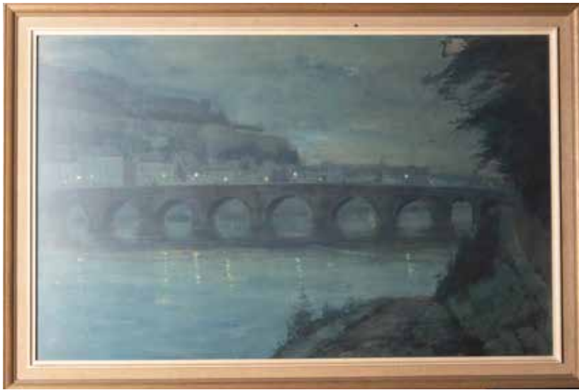
DÉSIRÉ MERNY Pont de Jambes la nuit (53 x 79 cm)

Portés par leur art vers d'autres contrées qui les mettent au contact du modernisme, plusieurs vont en intégrer certaines pratiques par petites touches ou du moins s'y essayer.