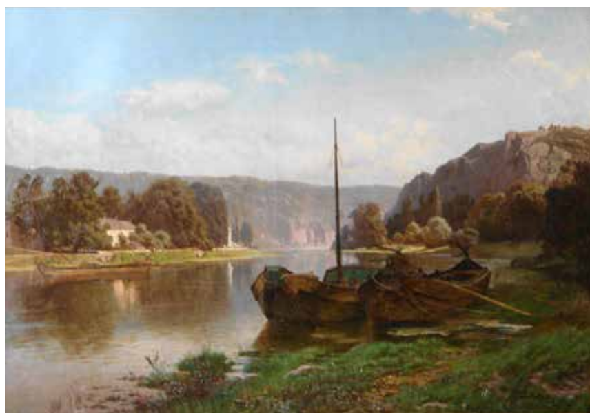
JOSEPH QUINAUX Bord de Meuse à Waulsort le matin (31 x 49 cm).

Les peintures des collections communales exposées illustrent le plaisir de représenter le paysage des peintres qui sont nés ou qui sont passés dans la vallée mosane. Qu'ils soient originaires ou non de Namur, ces artistes ont en commun leur attachement profond à une tradition picturale romantique dans un premier temps, réaliste ensuite.