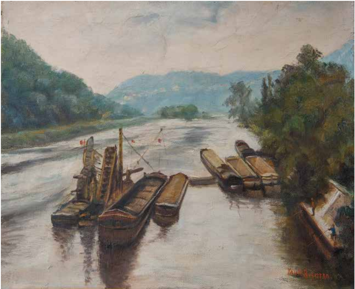
PAULE BISMAN La Semois à Chiny (102 x 117 cm).