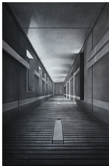
Hospice d'Harscamp - couloir 01, 2026, dessin au fusain, crayon et encre, 200 x 150 cm