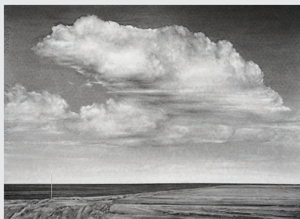
Michel Peetz, Atlantikwall 01, 2023, fusain, pierre noire et encre de Chine sur papier, 53 x 74 cm

De rester avec l'image, jusqu'à ce qu'elle tienne.