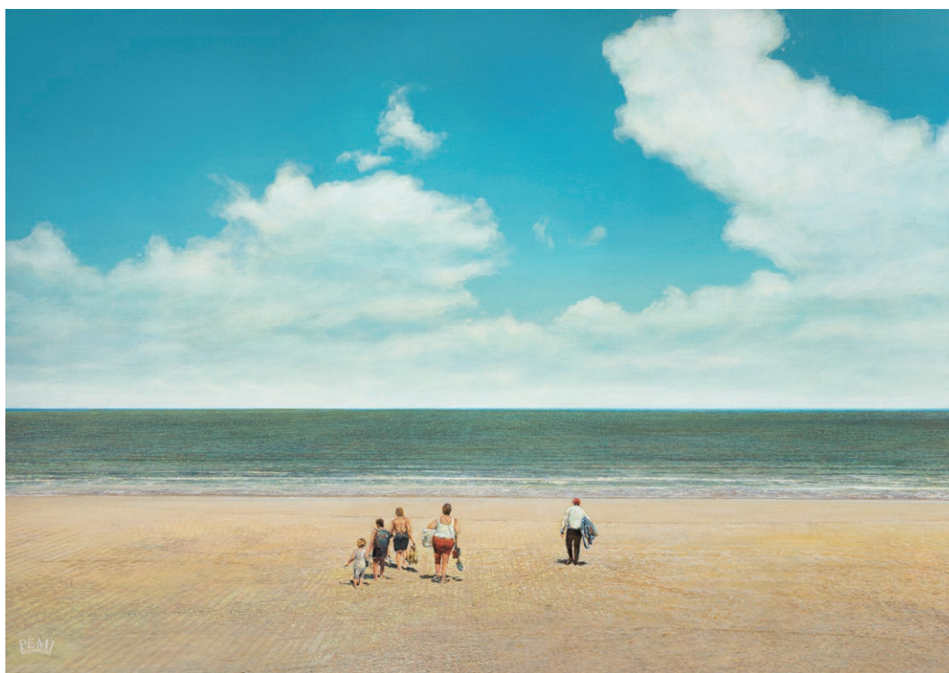
Michel Peetz, Images d'été 01, la plage, 2019, acrylique sur carton vergé, 42 x 60 cm