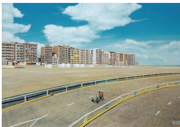
Michel Peetz, Images d'été 03, Autodroom, 2025, acrylique sur carton vergé, 42 x 60 cm