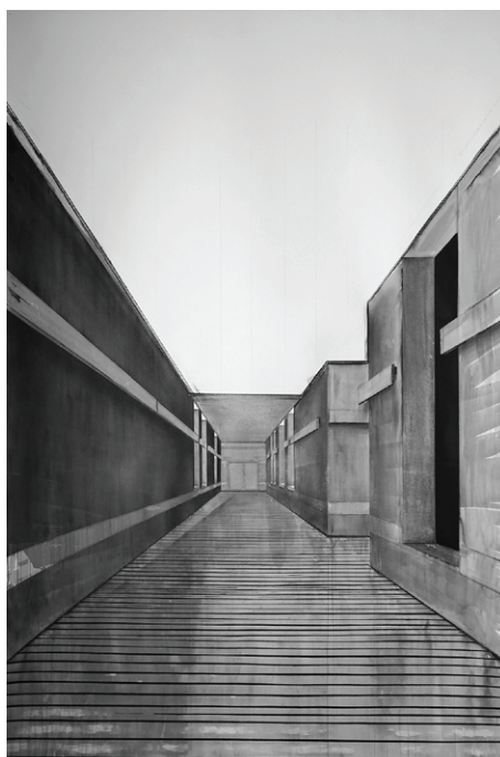
Hospice d'Harscamp - couloir 02, 2026, dessin au fusain, crayon et encre, 200 x 150 cm

L'artiste non plus, au moment de la faire.