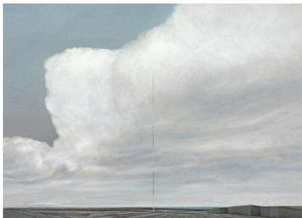
Michel Peetz, Lumières du Nord 03, 2025, huile sur toile, 60 x 90 cm

Peindre, c'est accepter de ne pas conclure.