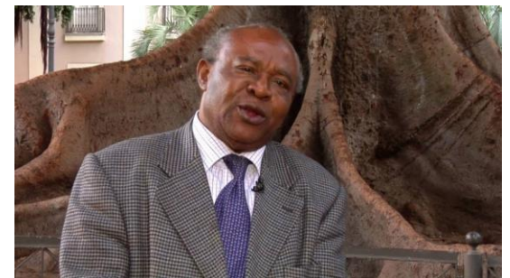
Don Donato Ndongo Biyogo, l'un des auteurs et référents les plus importants de la littérature équatorienne et hispano-africaine.

La voix de la Guinée équatoriale dans la littérature africaine est incontournable parce qu'elle est aussi la seule voix hispanique de l'Afrique noire, et le seul pont de l'Afrique vers l'Amérique latine, un continent où se trouvent des millions et des millions d'enfants d'Afrique abandonnés à leur sort à cause des maux du destin dont le peuple noir a été victime.