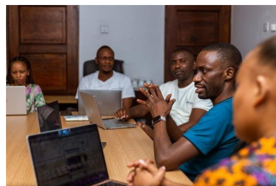
L'entrepreneuriat numérique est le principal moteur de la croissance des technologies, des entreprises et des services dans des pays tels que le Kenya, la Tanzanie, l'Ouganda et le Nigeria..

Qu'il s'agisse de services touristiques et de l'organisation de forfaits pour vendre des services aux clients qui veulent visiter ou faire des affaires en Afrique, de l'immobilier et de l'agriculture collective, du commerce électronique ou des technologies financières, l'Afrique est en train de devenir la Mecque de l'entrepreneuriat. La principale avancée technologique africaine de 2021 est qu'il devient plus facile pour les jeunes entreprises de conclure des tours de financement de 100 millions de dollars, comme l'ont fait Wave, MFS Africa, TradeDepot et environ huit autres. La tendance s'est poursuivie cette année avec InstaDeep, PalmPay, Flutterwave, Moove et Wasoko (anciennement Sokowatch)..