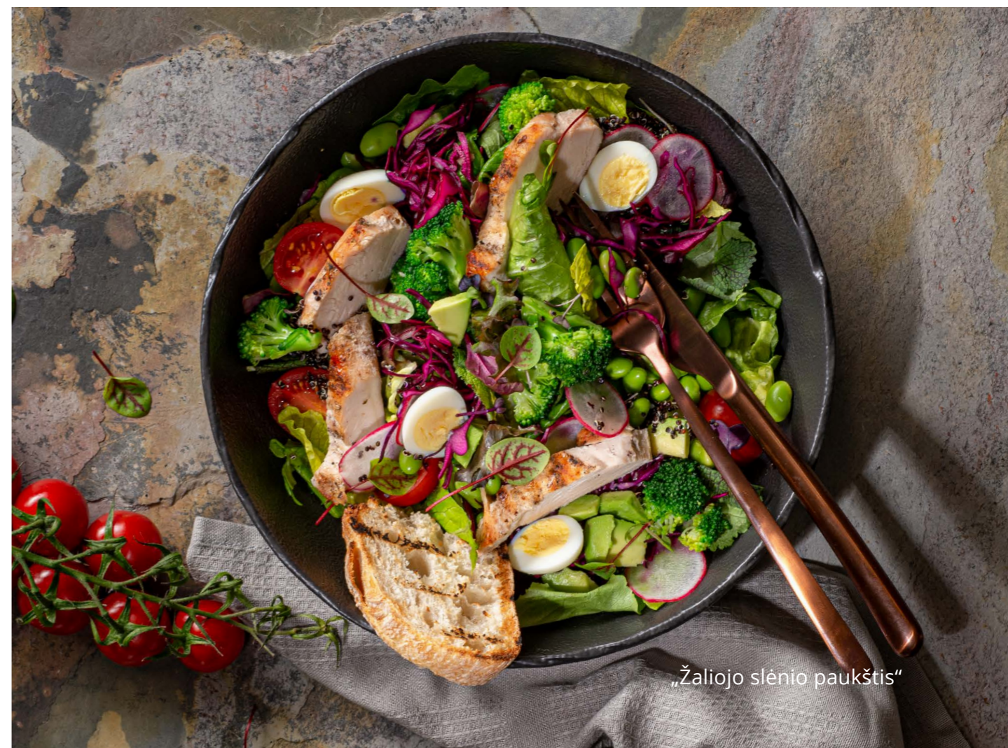
„Žaliojo slėnio paukštis“