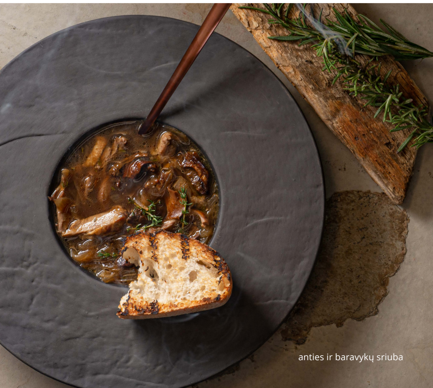
anties ir baravykų sriuba

...išbandėm – spragėsiai nepadeda, tad šviežios duonelės garantuojam!