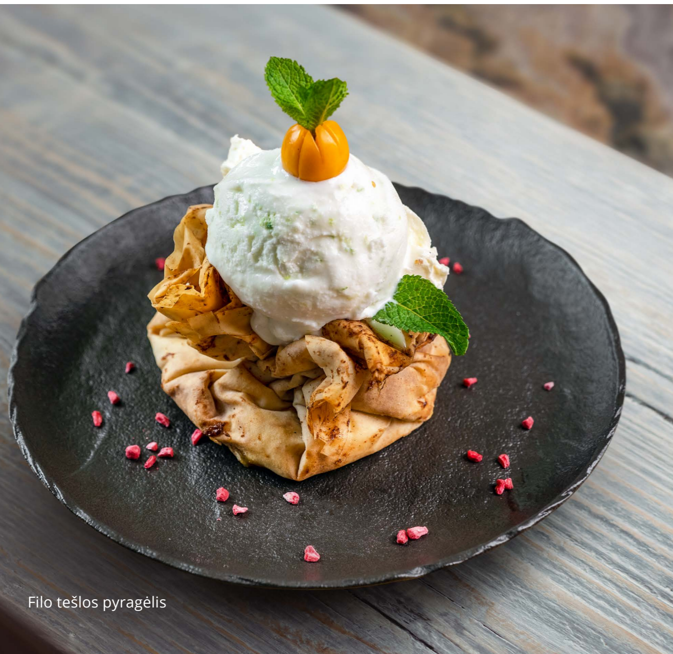
Filo tešlos pyragėlis